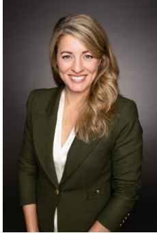
L'honorable Mélanie Joly Ministre du Développement économique et des Langues officielles

Grâce à toutes ces initiatives et à d'autres, nous continuons de respecter notre engagement envers la promotion d'une économie dynamique et croissante qui crée des emplois, des possibilités et une meilleure qualité de vie pour tous les Canadiens.