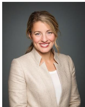
L'honorable Mélanie Joly Ministre du Développement économique et des Langues officielles

Ce ne sont là que quelques exemples du travail de CanNor au nom des Canadiennes et des Canadiens grâce à la collaboration, au dialogue et aux partenariats partout au pays. Nous vous invitons à lire le rapport pour en savoir plus sur ce que nous faisons avec les Canadiens et pour eux afin de bâtir notre nation d'innovation.