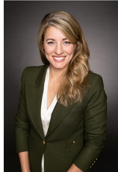
L'honorable Mélanie Joly Ministre du Développement économique et des Langues officielles

Ensemble, nous concrétiserons notre engagement de favoriser une économie dynamique et prospère qui crée des emplois, attire des investissements mondiaux, respecte les objectifs environnementaux et offre les possibilités aux Canadiens d'avoir une bonne qualité de vie.