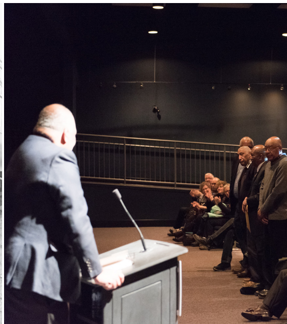
Le chef cuisinier et les porteurs près du train, Grand Trunk Pacific Railway.