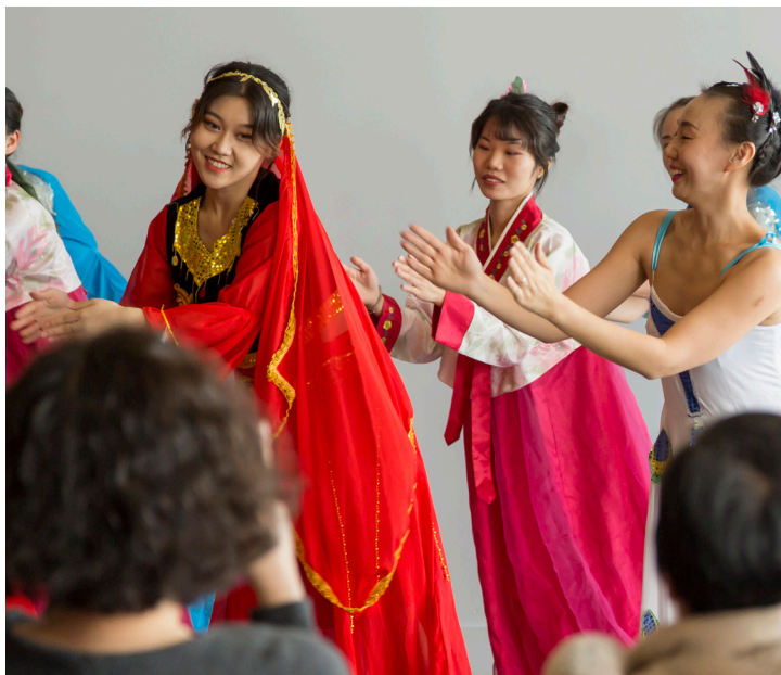
Célébration du Nouvel An lunaire avec des spectacles et de la musique.