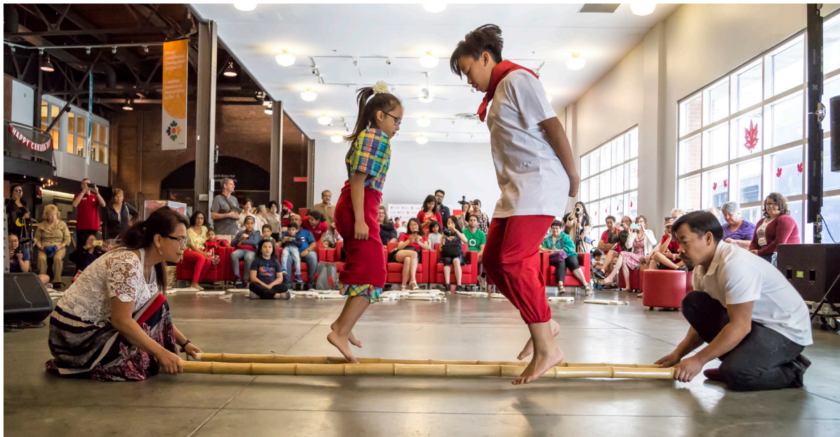
Spectacle de danse Timikling à l'occasion de la fête du Canada.