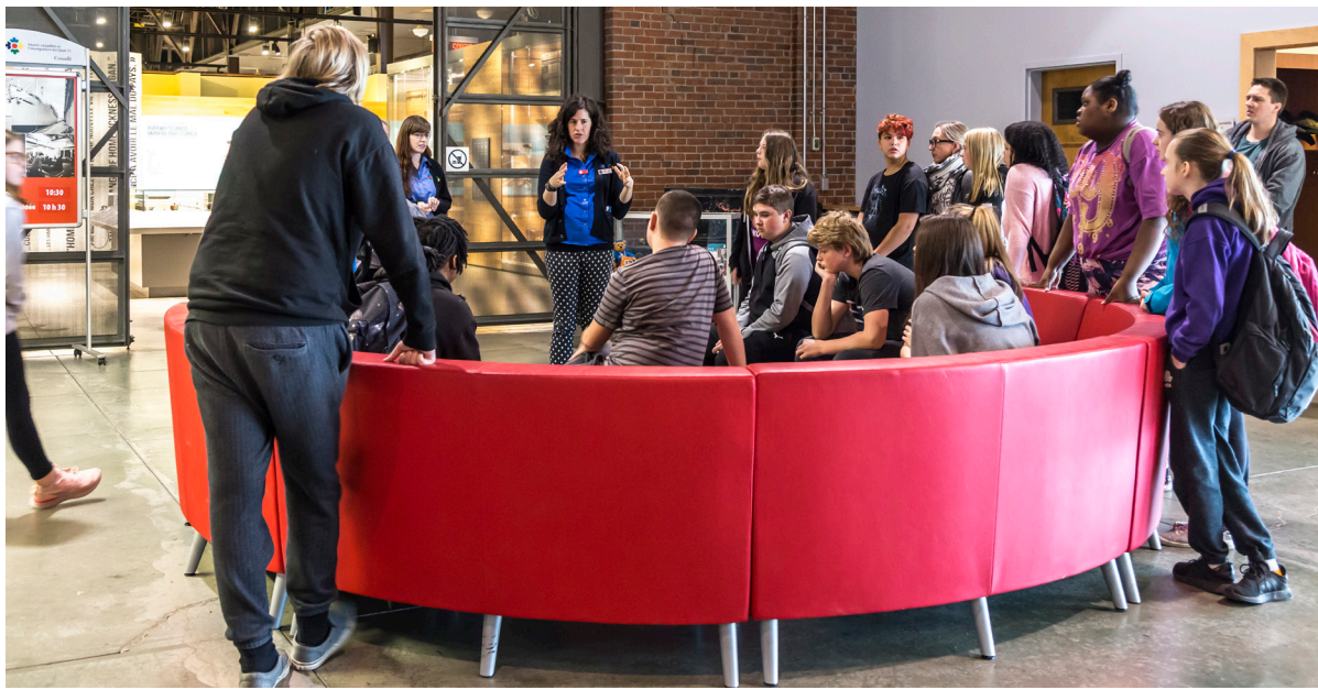
Un groupe scolaire se réunit dans la Salle Mirella et Lino Saputo.