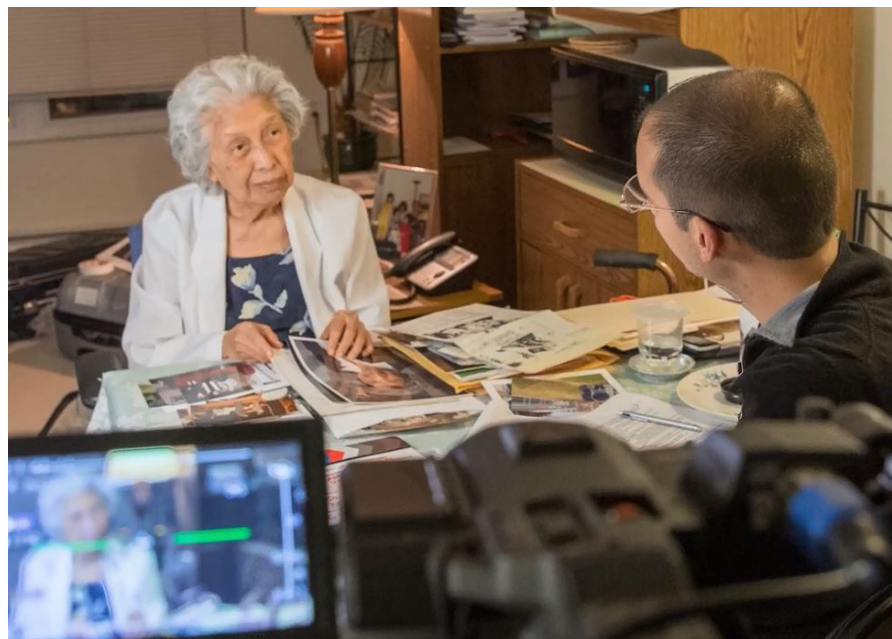
Légende : Vivre une entrevue d'histoire orale.