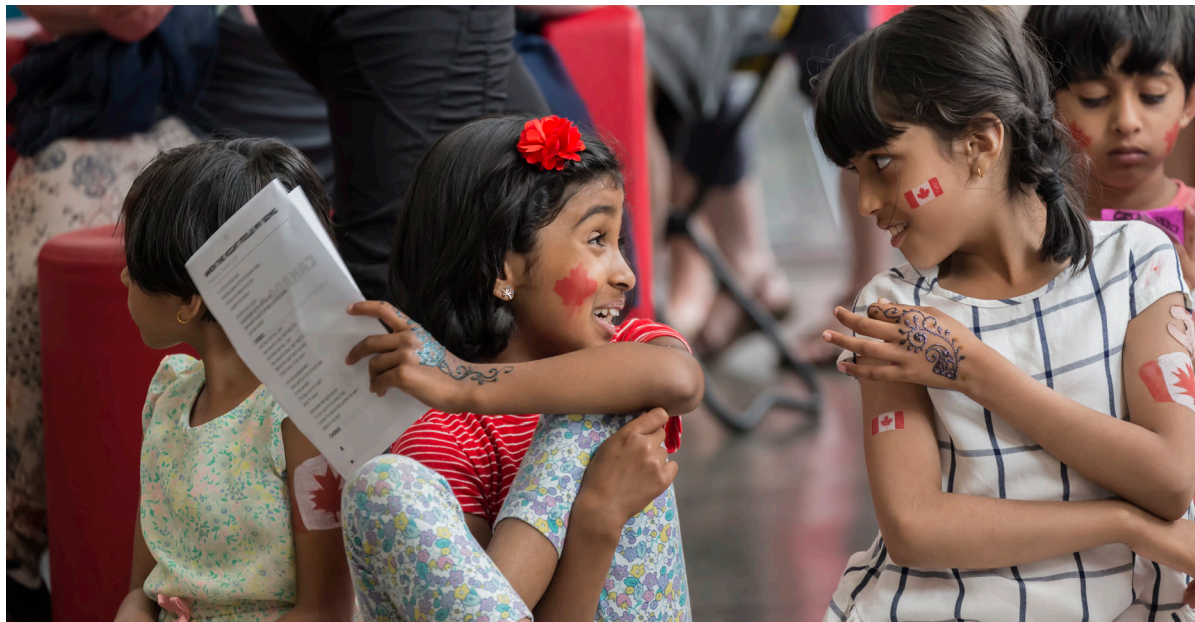
Comparaison des tatouages au henné lors de la fête du Canada.