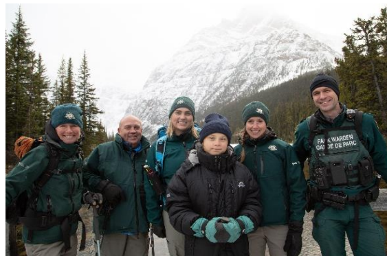
Greta Thunberg en compagnie d'employés de Parcs Canada.

La visite de Greta fera l'objet d'un documentaire réalisé par une équipe de la BBC qui a suivi la jeune fille tout au long de son voyage en Amérique du Nord. Le documentaire vise à sensibiliser les jeunes du monde entier à l'écosystème de montagne du parc national Jasper.