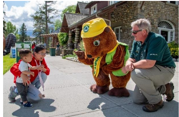
La mascotte Parka accueille des visiteurs à l'occasion de la Journée des parcs 2019.

Parcs Canada a l'honneur de présenter un sommaire du travail qu'il a accompli dans le parc national Jasper en 2019 et rend compte des progrès réalisés dans la mise en œuvre du plan directeur du parc national Jasper.