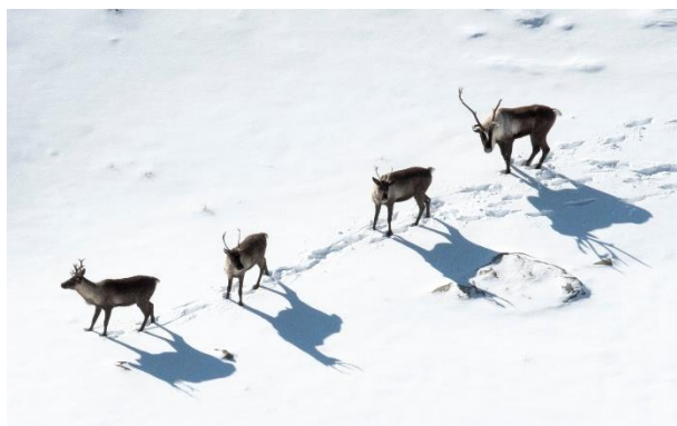
Caribous dans le parc.

La densité des loups est faible, ce qui laisse entendre que les conditions sont désormais plus propices à la survie et au rétablissement du caribou. Nous continuons de surveiller les conditions écologiques de l'habitat du caribou pour les quatre hardes.