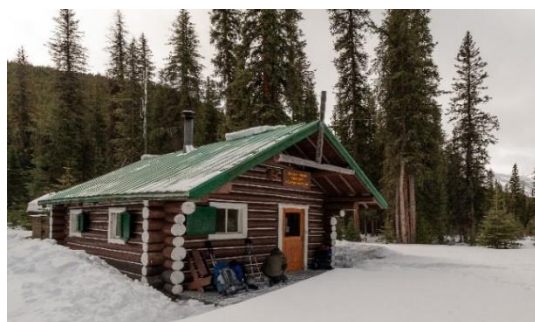
Chalet du Lac-Jacques

Parcs Canada et le Club alpin du Canada ont conclu à l'essai un accord de trois ans pour l'exploitation hivernale du chalet de patrouille du Lac-Jacques, qui offre aux visiteurs une possibilité d'hébergement rustique en arrière-pays, au bout d'une piste de niveau intermédiaire.