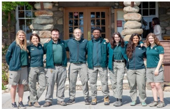
Équipe chargée des patrouilles en 2019

L'équipe de la Sécurité des visiteurs du parc est chargée de la recherche de personnes manquantes à l'appel, des services médicaux d'urgence dans l'arrière-pays et des sauvetages en cas de traumatismes dans le parc. En 2019, elle a mené à bien 174 interventions.