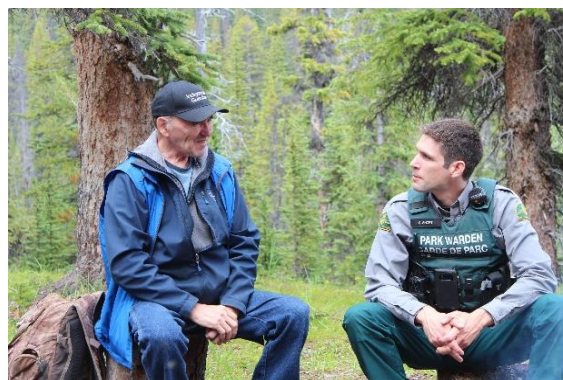
Un gardien autochtone et un garde de parc échantent des récits.

En juillet 2019, neuf partenaires autochtones locaux agissant comme gardiens autochtones sont venus travailler aux côtés d'employés de Parcs Canada pour apprendre à leur contact et leur transmettre leur savoir. Les participants ont indiqué que ce programme leur avait permis de renouer avec les terres de leur territoire ancestral et qu'il constituait un pas important vers la réconciliation.