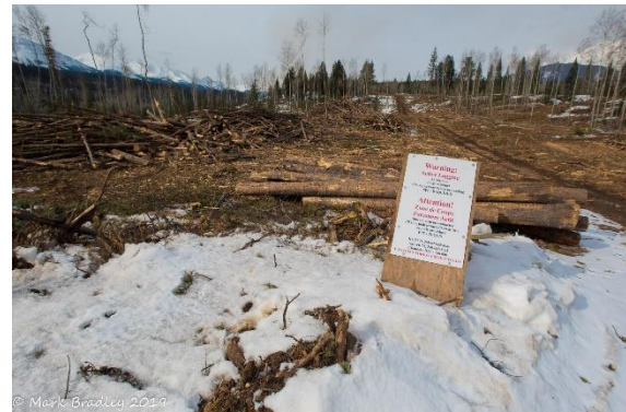
Dégagement de la ligne d'arrêt sur la terrasse Pyramid.

Parcs Canada et la Municipalité de Jasper sont des partenaires actifs du programme de protection communautaire Intelli-feu. En 2019, nous avons éclairci des parcelles boisées entourant la ville afin de réduire le volume de combustible près des lieux habités ainsi que de dégager et de sécuriser des voies d'accès et de sortie en cas d'urgence.