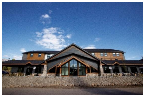
La nouvelle auberge Hostel International Jasper