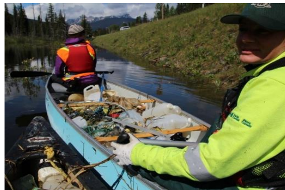
Nettoyage des rives

Plan d'action pour les rives du parc national Jasper, soit de remettre en état les lacs, les cours d'eau et l'habitat riverain du parc. En 2020, nous rappellerons aux propriétaires de bateaux qu'ils doivent retirer les embarcations entreposées sur les rives des lacs.