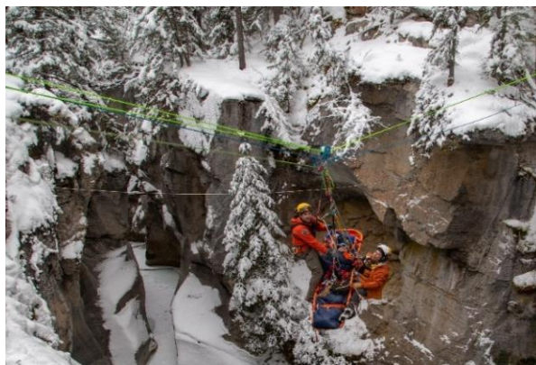
Formation dans le canyon Maligne

L'équipe surveille et gère 76 couloirs d'avalanche donnant sur la route 93 Nord et la route du Lac-Maligne. En 2019, elle a exécuté sept opérations de déclenchement préventif qui ont entraîné la fermeture de la promenade pendant 19 jours. L'équipe a utilisé au total 4 200 kg d'explosifs pour déclencher des