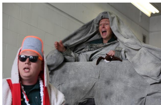
Pièce de théâtre Bats in the Dark (Des chauves-souris dans l'obscurité).