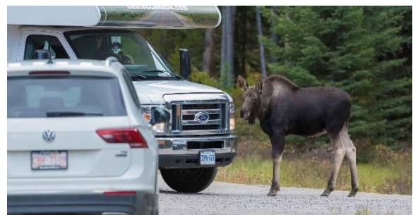
Embouteillage causé par la faune