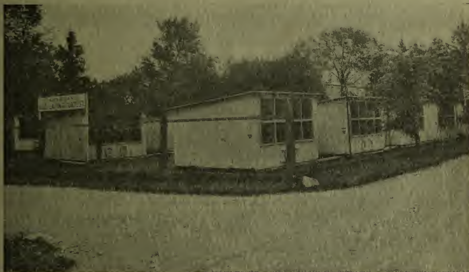
Un coin du concours de ponte national canadien, Ottawa

DOMINION DU CANADA MINISTÈRE FÉDÉRAL DE L'AGRICULTURE