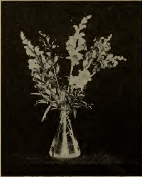
Mufier ou Gueule de loup.