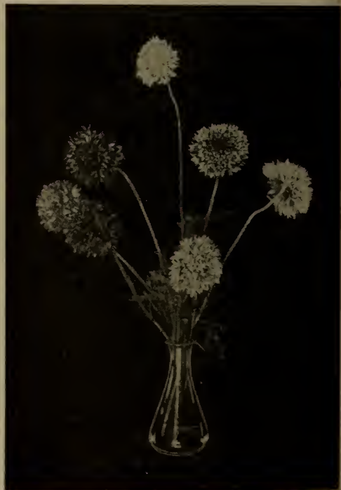
Gaillardie à fleurs doubles.