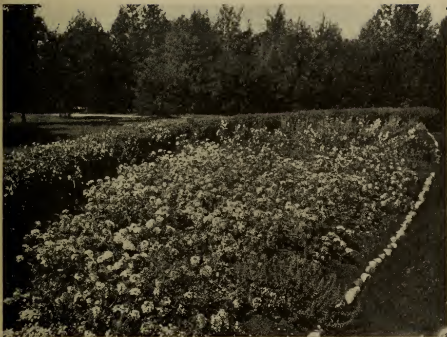
Plate-bande de verveines à la ferme expérimentale fédérale d'Indian Head, Sask.