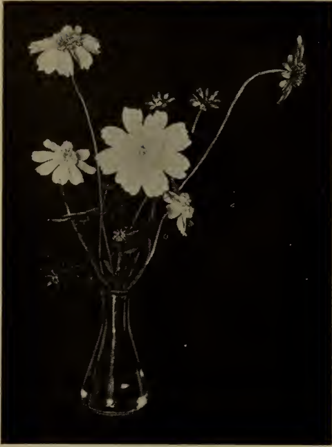
Cosmos à fleurs doubles.