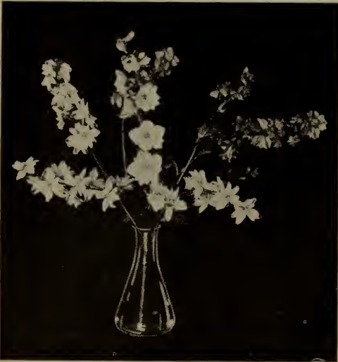
Pied d'alouette—A fleurs de giroflée (Voir Delphinium .)