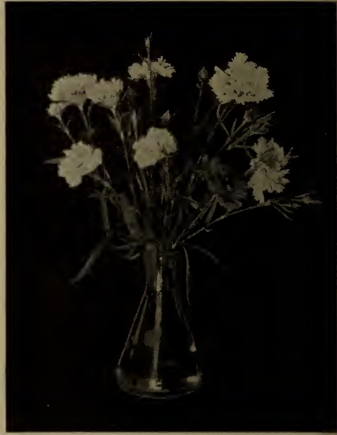
Dianthus heddeewigi —A fleurs doubles.