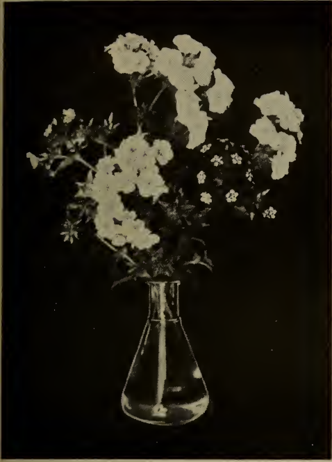
Phlox de Drummond.