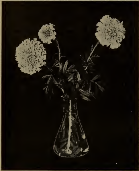
Souci d'Afrique. (Voir Tagetes ).