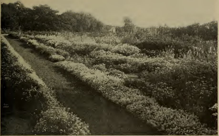
Fleurs annuelles poussant à la ferme centrale, Ottawa. Partie des terrains d'essai où les variétés et les méthodes de culture sont à l'épreuve.