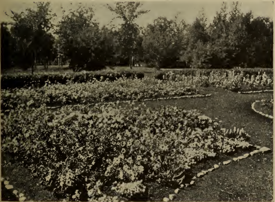
Pétunias à la ferme expérimentale fédérale, Indian Head, Sask.