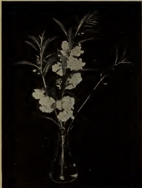
Balsamine—A fleur de camélia. (Voir Impatiens .)