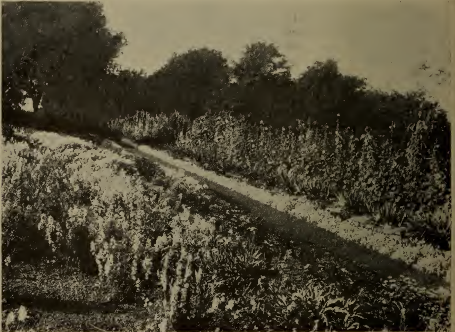
Fleurs annuelles à la ferme centrale, Ottawa; on voit ici une plate-bande d'alysses et d'ibérides.