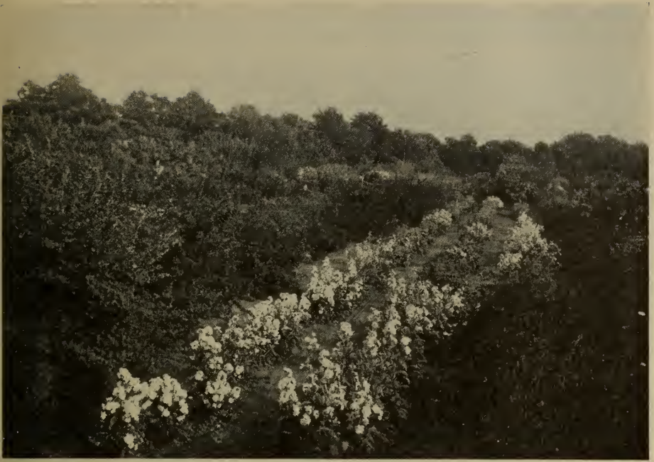
Giroflées de dix semaines à la ferme expérimentale centrale, Ottawa.