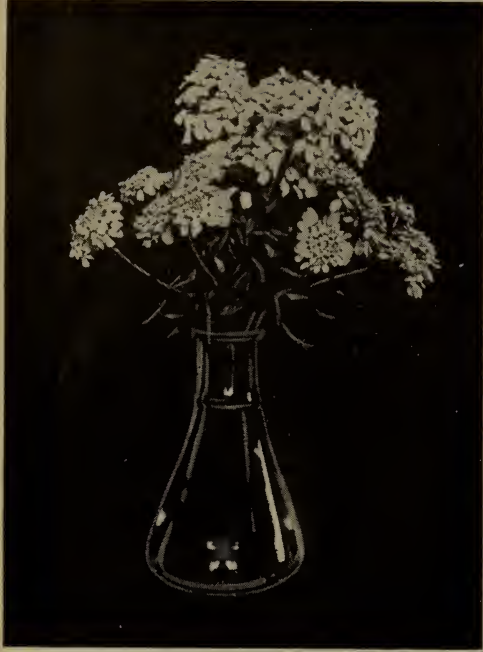
Ibérïde—(Voir Ibérïis ).