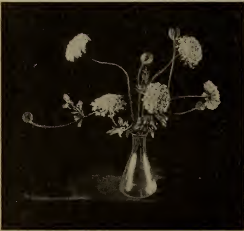
Didiscus cœrulea .