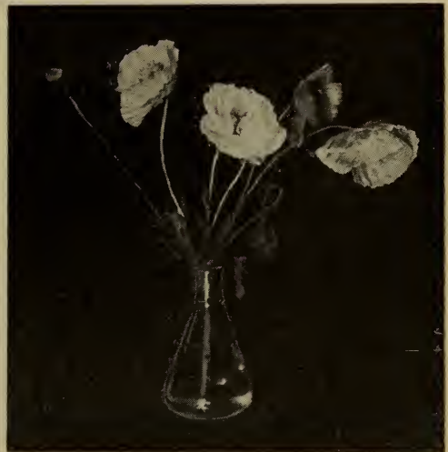
Pavot annuel—Variété ranunculus de France. (Voir Papaver ).