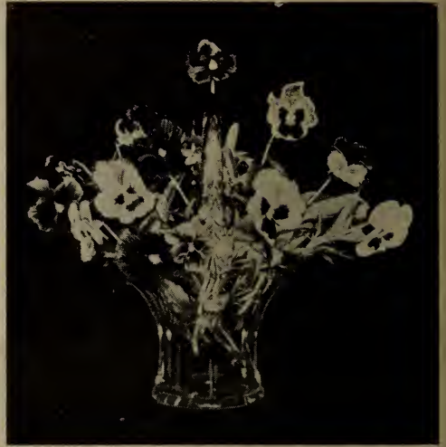
Pensées. (Voir descriptions sous l'en-tête Viola ).