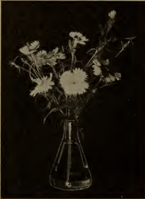
Dianthus heddeewigi —A fleurs simples.