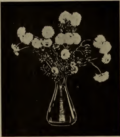
Chrysanthème—“Robe de mariée” (Bridal Robe).