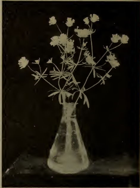
Aspérule azurée d'Orient.