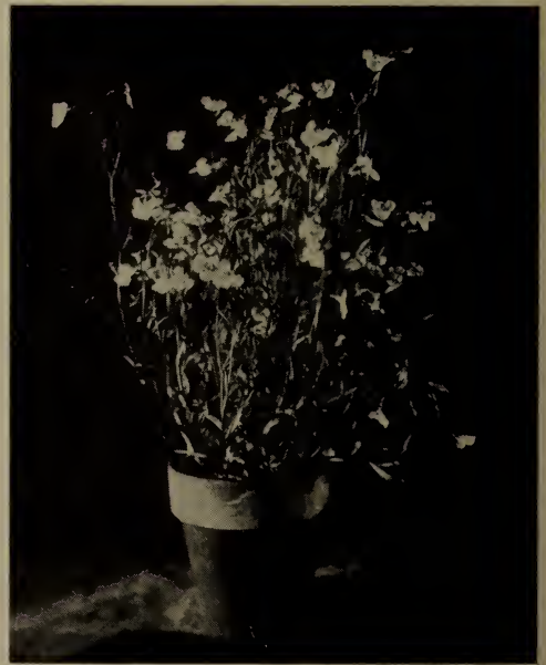
Lobelia tenuior .