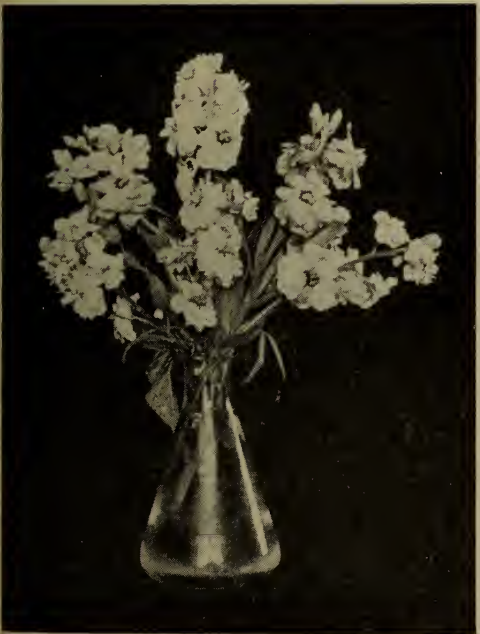
Giroflée de dix semaines. (Voir Matthiola ).