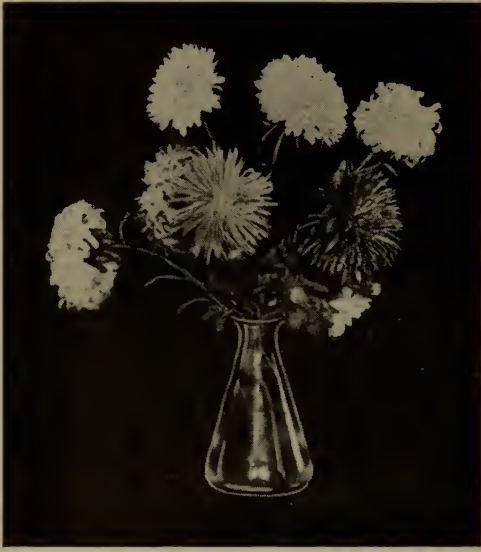
Aster de Chine (Voir Callistephus ).