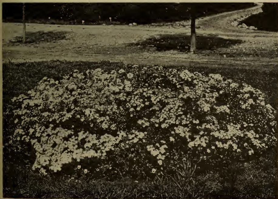
Phlox de Drummond cultivés à la ferme expérimentale fédérale de Brandon, Man.