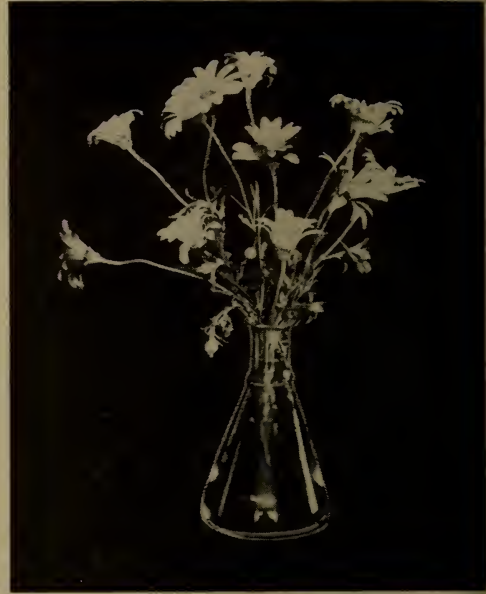
Dimorphothèque ou Souci d'hiver.