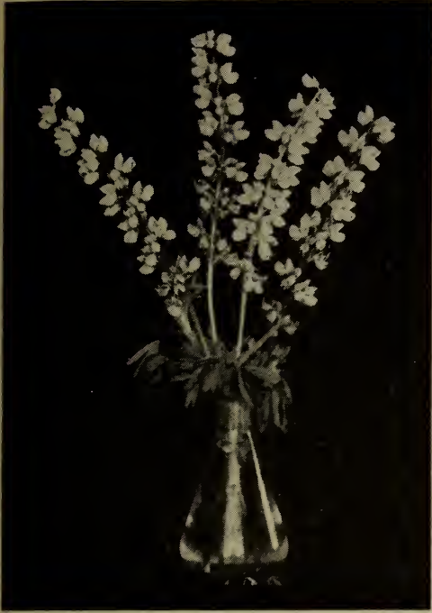
Lupins. (Voir Lupinus ).