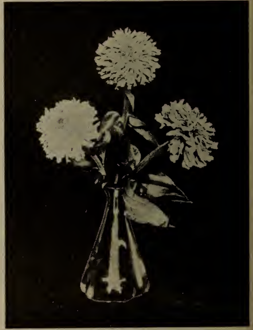
Zinnia—"Frisée et à crête".