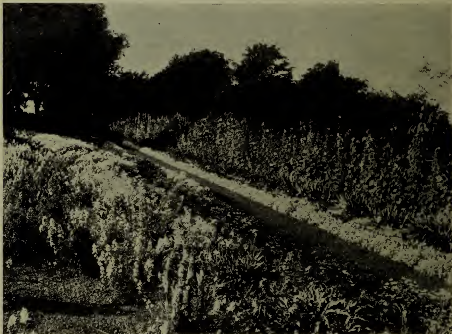
Fleurs annuelles à la ferme centrale, Ottawa; on voit ici une plate-bande d'alysses et d'ibérides.

1 Mélange de son empoisonné pour détruire les vers gris.—Mélanger parfaitement \frac{1}{2} liv. de vert de Paris avec 20 liv. de son à sec. Faire dissoudre 1 pinte de mélasse dans 2 gallons ou plus d'eau, verser cette solution sur le son empoisonné et agiter jusqu'à ce que tout le son soit parfaitement humecté. Pour des quantités plus petites, on emploie 1 pinte de son, 1 cuillerée à thé de vert de Paris et 1 cuillerée à table de mélasse et suffisamment d'eau pour humecter le son empoisonné. On éparille sur la surface du sol près des plants dès que ces derniers sont transplantés. Les vers gris sortent la nuit, mangent le son empoisonné et meurent.