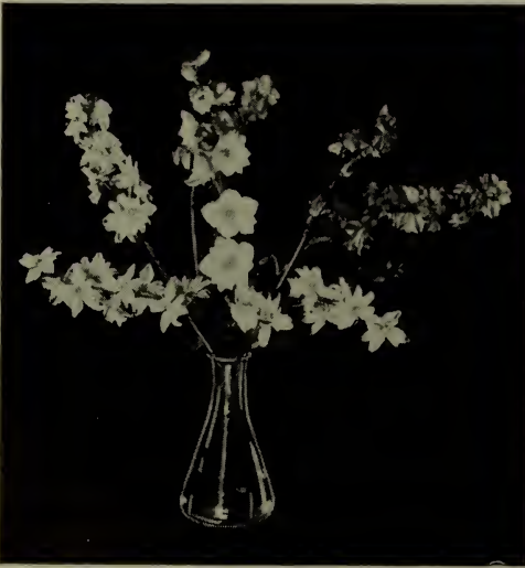
Pied d'alouette—A fleurs de giroflée (Voir Delphinium .)