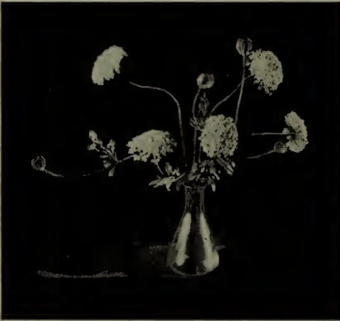
Didiscus cœrulea .