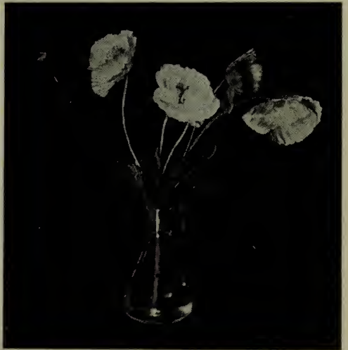
Pavot annuel—Variété ranunculus de France. (Voir Papaver ).