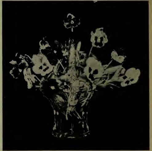
Pensées. (Voir descriptions sous l'en-tête Viola ).