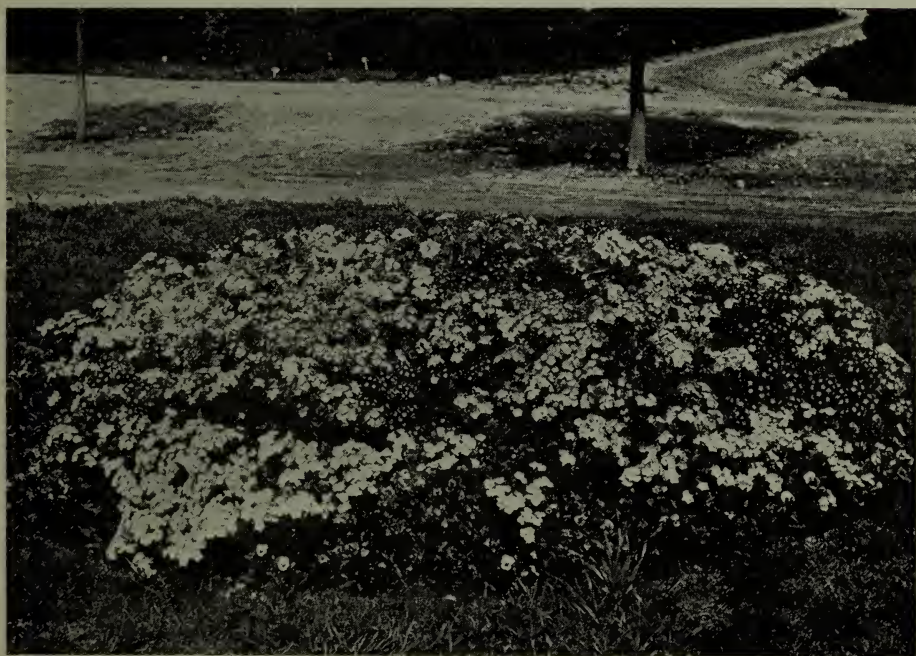
Phlox de Drummond cultivés à la ferme expérimentale fédérale de Brandon, Man.