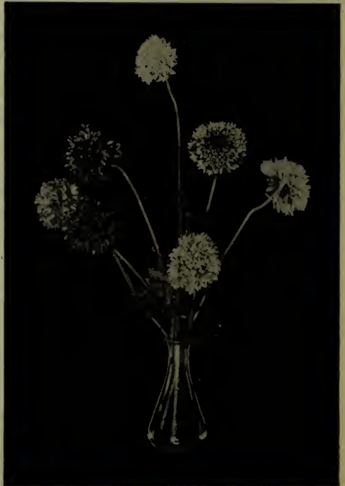
Gaillardie à fleurs doubles.