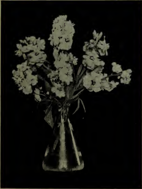
Giroflée de dix semaines. (Voir Matthiola ).