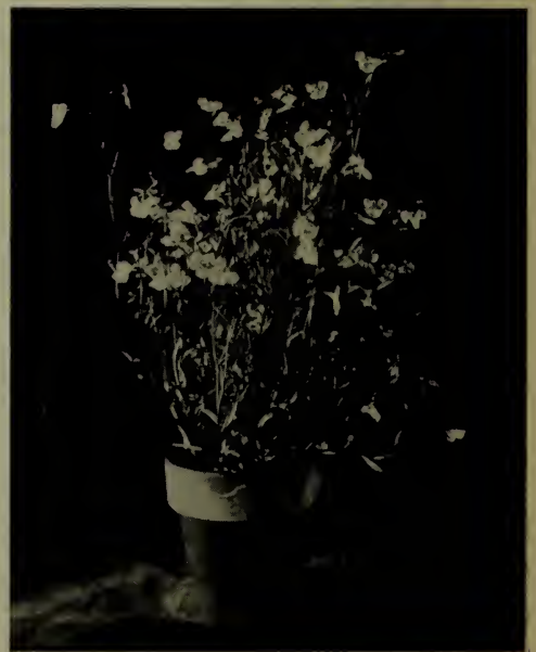
Lobelia tenuior .