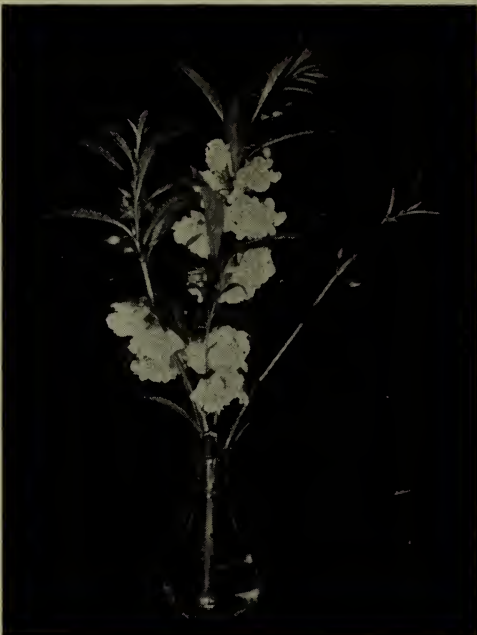
Balsamine—A fleur de camélia. (Voir Impatiens .)