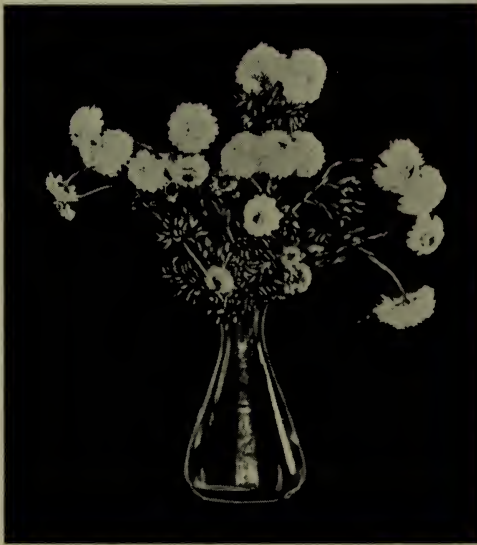
Chrysanthème—“Robe de mariée” (Bridal Robe).