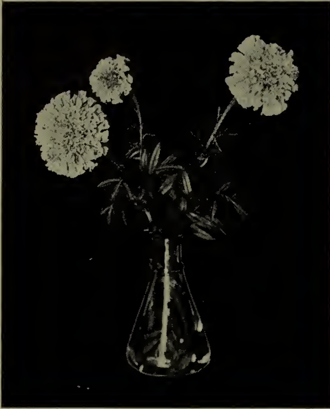
Tagète d'Afrique. (Voir Tagetes ).