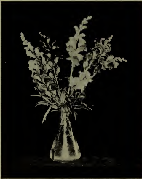
Mufier ou Gueule de loup.