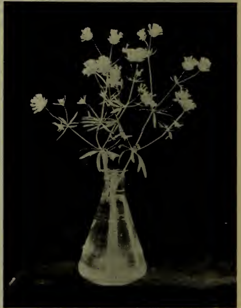
Aspérule azurée d'Orient.