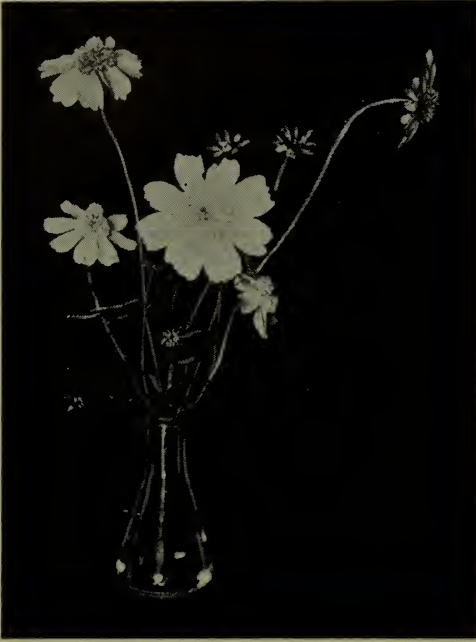
Cosmos à fleurs doubles.