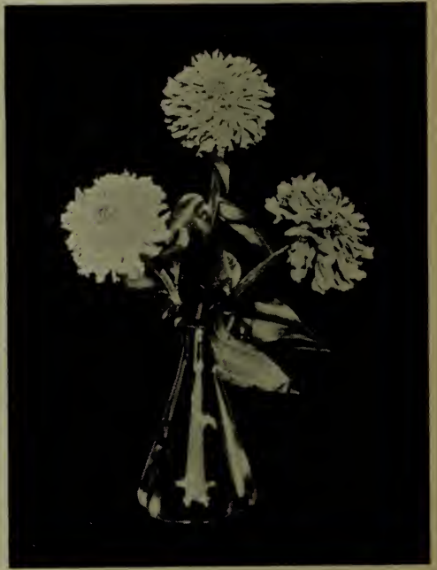
Zinnia—"Frisée et à crête".