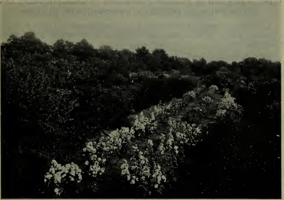
Giroflées de dix semaines à la ferme expérimentale centrale, Ottawa.