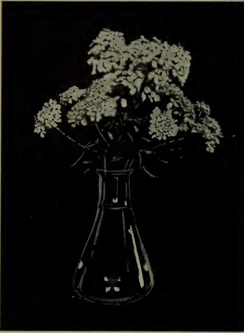
Ibérïde—(Voir Ibéris ).