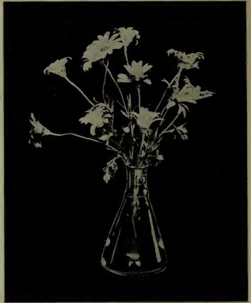
Dimorphothèque ou Souci d'hiver.