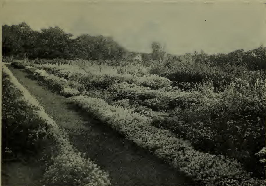
Fleurs annuelles poussant à la ferme centrale, Ottawa. Partie des terrains d'essai où les variétés et les méthodes de culture sont à l'épreuve.