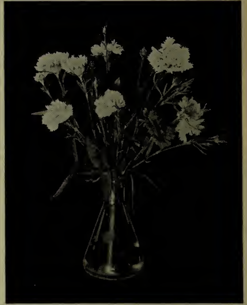
Dianthus heddeewigi —A fleurs doubles.