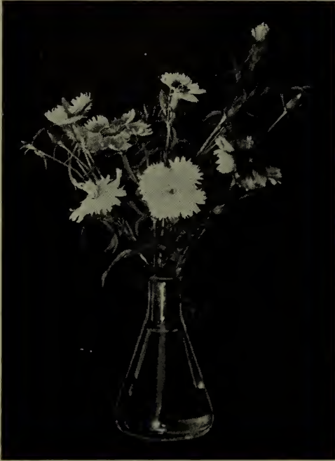
Dianthus heddeewigi —A fleurs simples.