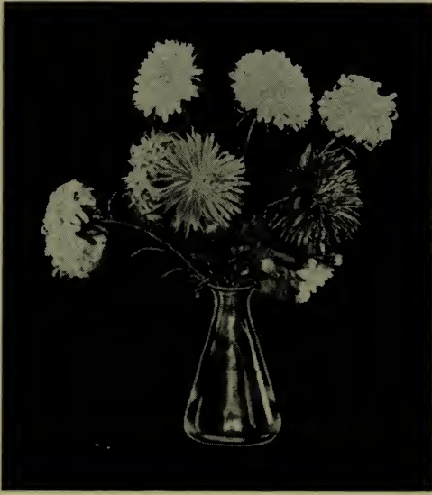
Aster de Chine (Voir Callistephus ).