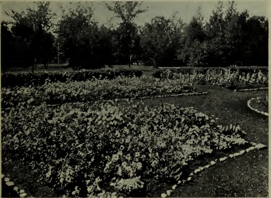
Pétunias à la ferme expérimentale fédérale, Indian Head, Sask.