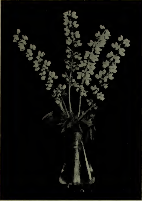
Lupins. (Voir Lupinus ).