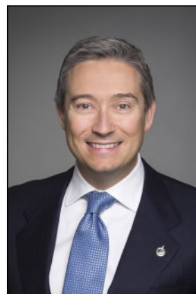
L'honorable François-Philippe Champagne Ministre de l'Innovation, des Sciences et de l'Industrie

Bien que la lutte contre la COVID-19 et la protection de la santé et de la sécurité de la population canadienne demeurent les priorités de notre gouvernement nous nous consacrons à instaurer un climat propice à l'investissement, tout en favorisant l'innovation canadienne pour stimuler la croissance dans des secteurs clés. Ensemble, nous renforcerons l'économie canadienne et nous rétablirons la confiance des consommateurs par la mise en œuvre de mesures stratégiques, notamment en investissant dans la formation pour les travailleurs et en appuyant les entreprises canadiennes pour qu'elles puissent s'adapter et assurer leur croissance dans une économie axée sur le savoir.