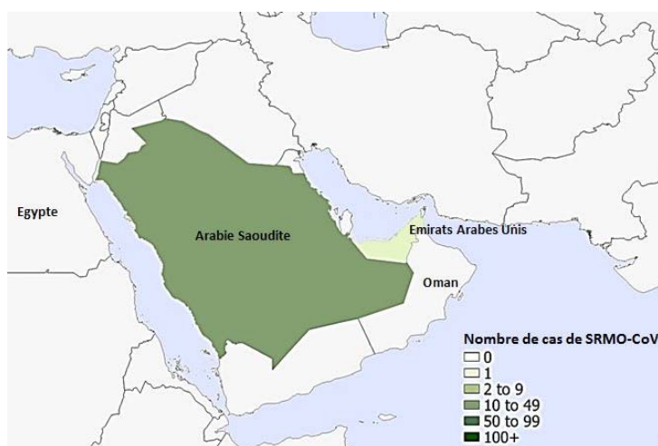
Figure 2. Répartition géographique des cas humains de SRMO- CoV signalés en octobre 2019 (n=14).

Remarque : Cette carte a été préparée par le Centre de l'immunisation et des maladies respiratoires infectieuses (CIMRI) à partir des données de l'OMS provenant des évaluations mensuelles des risques grippaux liés à l'interface entre l'homme et l'animal. La carte reflète les données de ces évaluations le 31 octobre 2019.