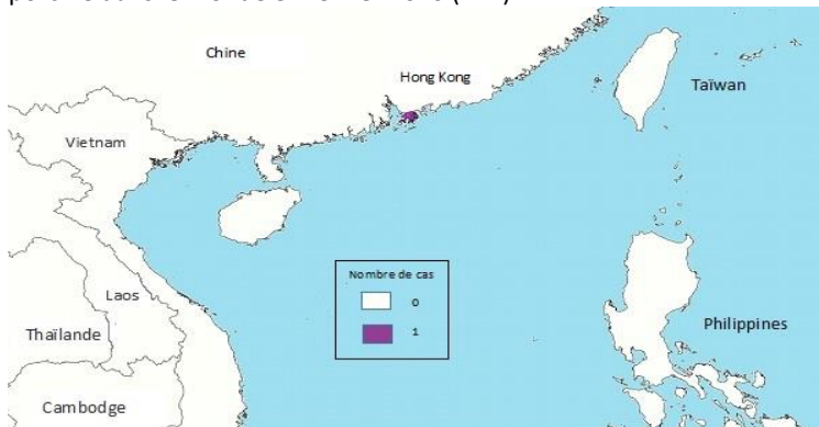
Figure 2. Répartition géographique des cas humains de grippe aviaire et porcine dans le monde en février 2020 (n=1).

Remarque : Cette carte a été préparée par le Centre de l'immunisation et des maladies respiratoires infectieuses (CIMRI) à partir des données des Bulletins sur les flambées épidémiques . Il reflète les données disponibles le 29 février 2020.