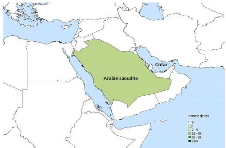
Figure 3. Répartition géographique des cas humains de SRMO-CoV signalés en février 2020 (n=19).

Remarque : Cette carte a été préparée par le Centre de l'immunisation et des maladies respiratoires infectieuses (CIMRI) à partir des données de l'OMS provenant des évaluations mensuelles des risques grippaux liés à l'interface entre l'homme et l'animal. La carte reflète les données de ces évaluations le 29 février 2020.