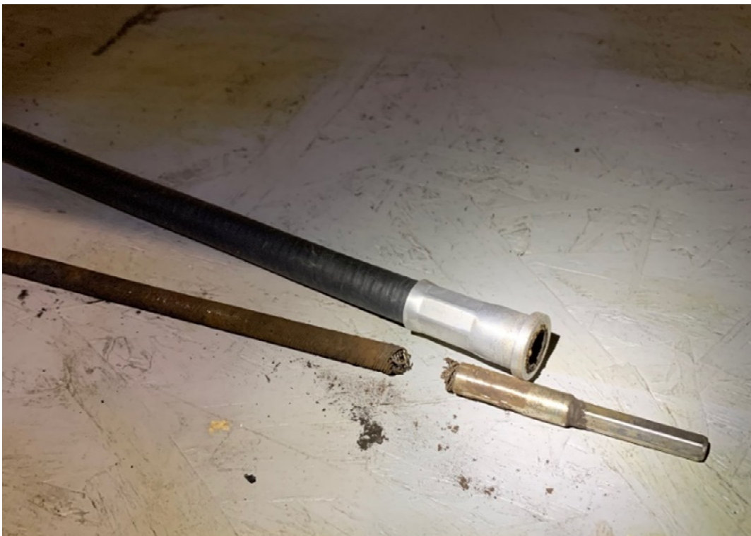
Figure 2. L'arbre d'entraînement flexible de volet défectueux de l'aéronef à l'étude

Dans l'événement à l'étude, l'arbre d'entraînement flexible de volet de gauche 7 qui raccorde les vérins intérieur et extérieur du volet intérieur gauche s'est rompu là où le noyau interne flexible est serti à l'extrémité de l'arbre du vérin de volet extérieur (figure 2).