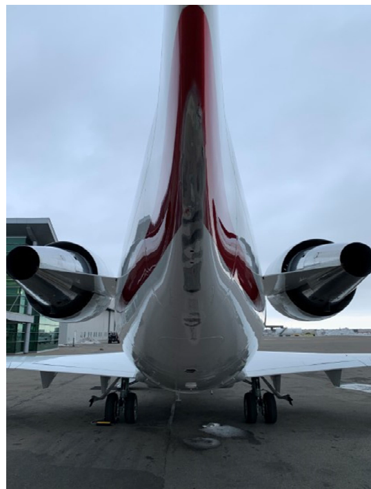
Figure 1. Dommages à la partie arrière du fuselage

La partie inférieure du fuselage avant a subi d'importants dommages structurels lorsque le train d'atterrissage avant est entré en contact