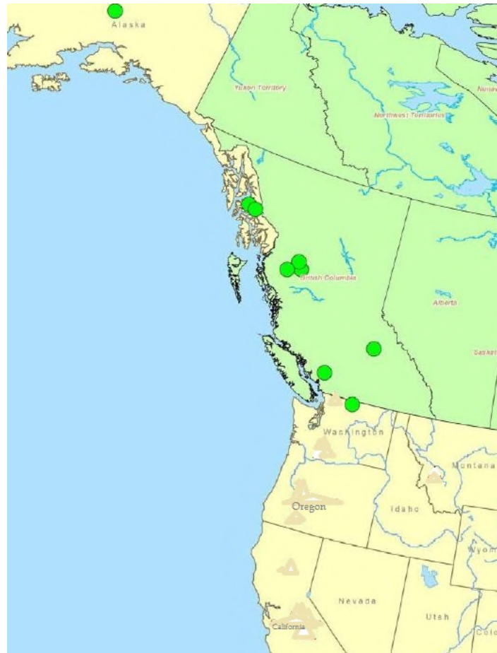
Figure 1. Répartition du peltigère éventail d'eau de l'Ouest en Amérique du Nord (adapté de COSEWIC, 2013).

Veillez voir la traduction française ci-dessous : Yukon Territory = Yukon Northwest Territories = Territoires du Nord-Ouest British Columbia = Colombie-Britannique