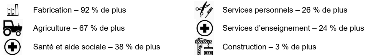
Tableau 1. Principaux secteurs d'activité de Morden : secteurs où la part de l'emploi est supérieure à la moyenne nationale*

*Par exemple, ajustement fait en fonction de la taille de la population, il y a 92 % plus de travailleurs dans le secteur manufacturier à Morden que dans le reste du pays.