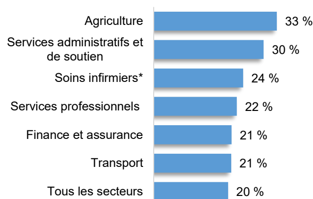
Figure 1. Proportion de travailleurs 1 de plus de 55 ans dans certains secteurs d'activité à Winkler

*Soins infirmiers et soins aux bénéficiaires compris.