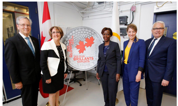
Figure 3 : Lancement officiel de la pièce de monnaie du 50 e anniversaire de la Loi