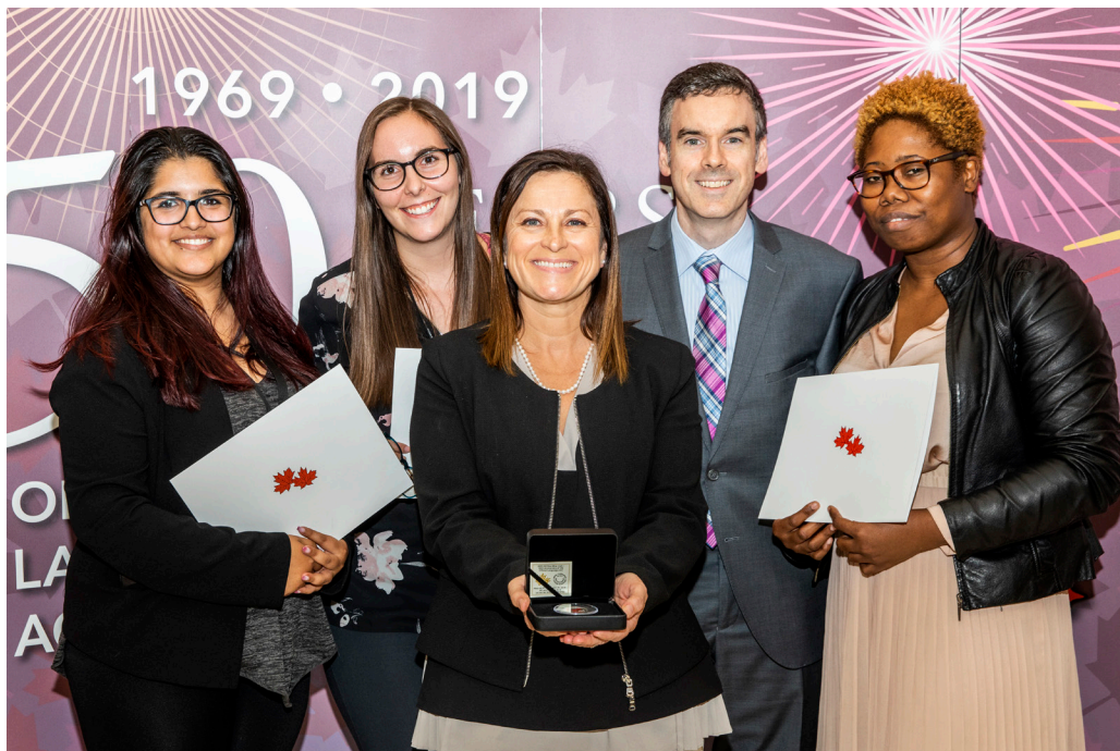
Figure 4 : Une équipe lauréate du Prix d'excellence et de leadership en langues officielles

La cérémonie de remise des prix a eu lieu lors des activités soulignant le 10 e anniversaire de la Journée de la dualité linguistique , le 12 septembre 2019. Les lauréats, représentant 26 institutions fédérales et provenant de diverses régions du pays, ont reçu un certificat et une pièce commémorative de la Monnaie royale canadienne spécialement conçue pour l'anniversaire.