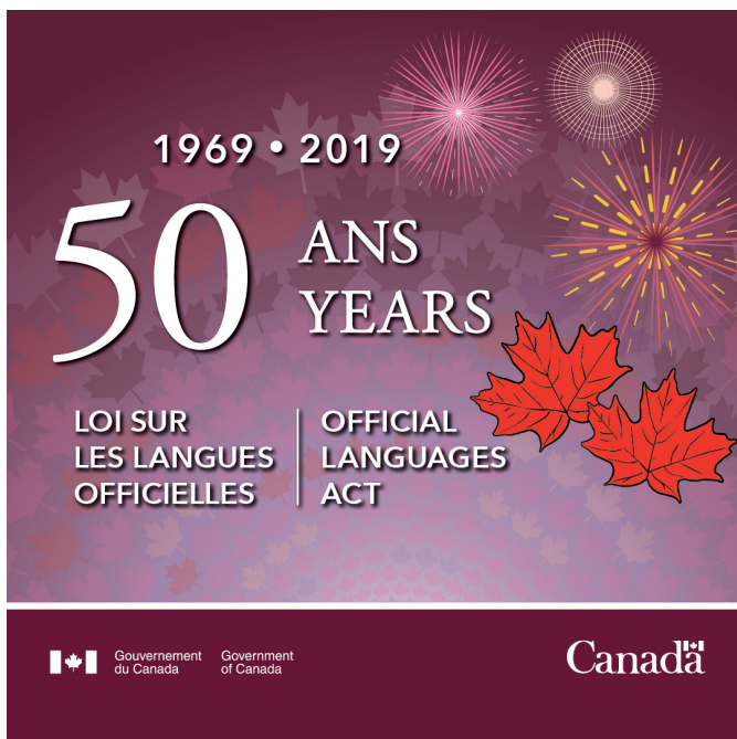
Figure 2 : Identité visuelle du 50 e anniversaire de la Loi sur les langues officielles

D'autres institutions fédérales ont également créé des éléments visuels pour souligner le jalon. La Monnaie royale canadienne a par exemple créé une pièce de monnaie à l'effigie du 50 e anniversaire de la Loi , qui a notamment été remise en guise de prix lors de diverses occasions soulignant cet événement. Le lancement officiel a été marqué en juin 2019 par la ministre responsable des langues officielles, le commissaire aux langues officielles et la secrétaire générale de la Francophonie qui étaient présents lors de la frappe de la pièce de monnaie.