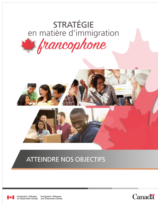
Figure 7 : Stratégie en matière d'immigration francophone

L'immigration joue un rôle déterminant dans la vitalité des communautés. Le Plan d'action 2018-2023 consacrait donc des sommes importantes à ce volet (plus de 40 millions de dollars supplémentaires en cinq ans) afin de faire porter la proportion d'immigrants francophones hors Québec à 4,4 pour cent dès 2023 (elle était de 2,8 pour cent en 2019). Ces efforts allaient permettre de créer un véritable parcours global d'intégration francophone qui commencerait avant l'arrivée de l'immigrant au pays et l'accompagnerait jusqu'à l'obtention de sa citoyenneté.