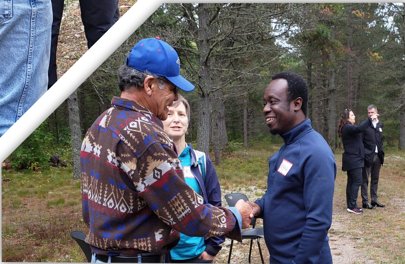
L'événement « L'engagement autochtone » de la Première Nation de Garden River en Ontario.