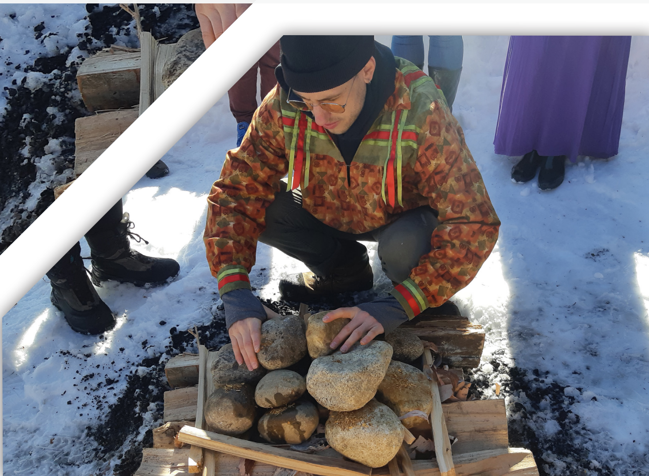
Événement de sensibilisation à la cérémonie autochtone de la suerie tenu dans la région de la capitale nationale.