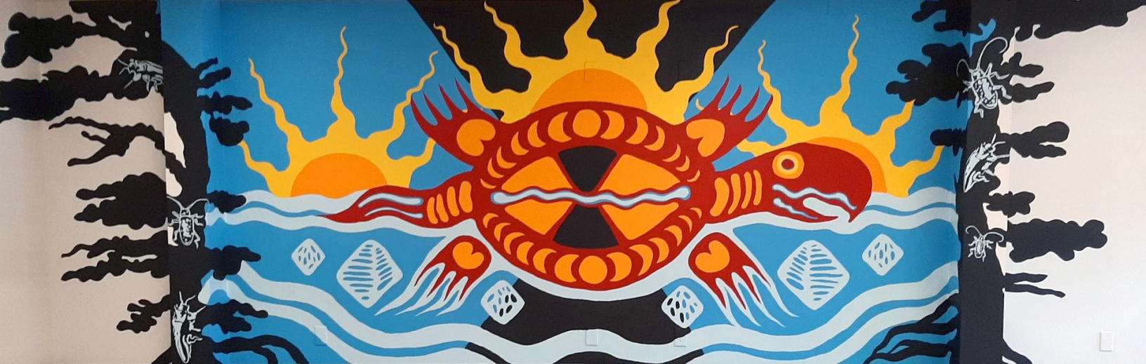
Zagasso, 2021 Murale exposée au Centre de foresterie des Grands Lacs (CFGL) à Sault Ste. Marie, Ontario.