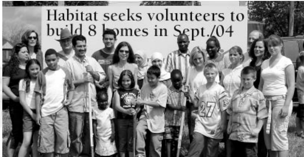
Windsor – Groundbreaking ceremony at the future site of seven new Habitat for Humanity townhomes. Windsor – Cérémonie d'inauguration des travaux au futur site de sept nouvelles maisons en rangée d'Habitat pour l'humanité.