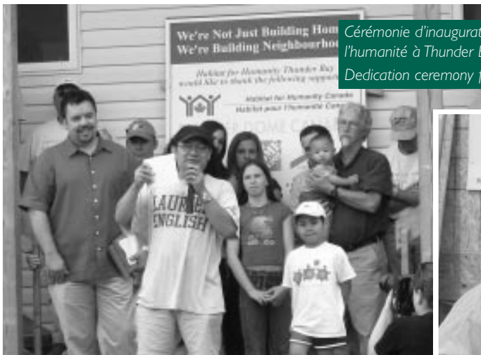
Cérémonie d'inauguration de deux maisons construites par Habitat pour l'humanité à Thunder Bay.

« À nos débuts à Toronto, il y a 16 ans, nous construisions une demi-maison par