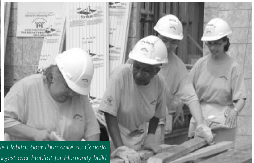
Toronto – La plus importante réalisation de Habitat pour l'humanité au Canada.

Dedication ceremony for two homes built by Habitat for Humanity in Thunder Bay.