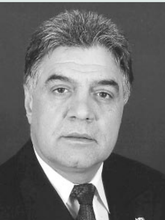
L'honorable Joe Fontana, ministre du Travail et du Logement.