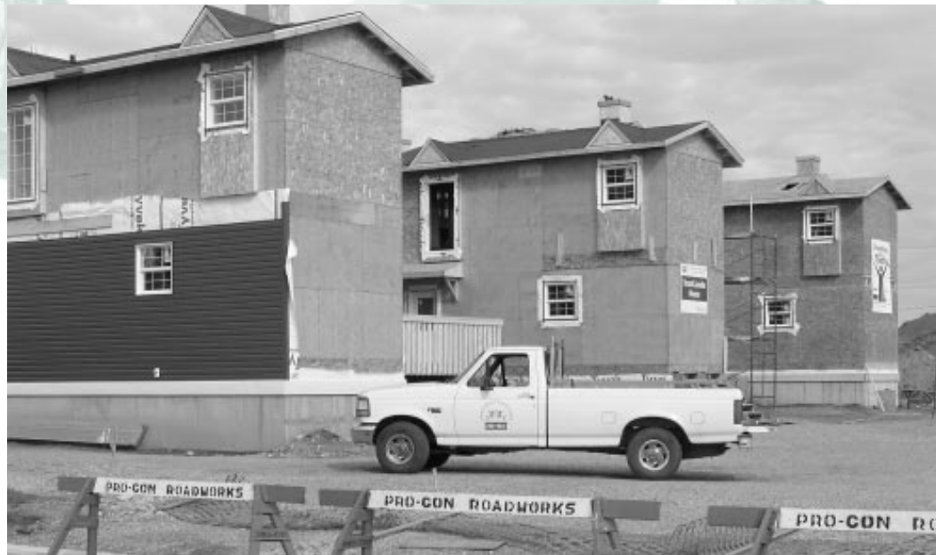
"Suncourt", the new South East Calgary Habitat project.

In addition, as part of this year's project, Habitat Calgary also introduced a new "sell-back" initiative, which encourages homeowners to undertake to sell their houses back to Habitat should they decide to move. With this new initiative in place, Habitat will be able to help even more low-income families within the same project for years to come ■