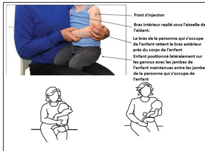
Figure 4 : repérage du muscle deltoïde

Adapté du Yukon Immunization Program : Manuel du programme d'immunisation du Yukon [4].