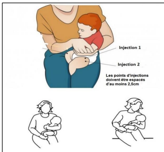
Figure 3 : repérage de la partie antérolatérale de la cuisse (muscle vaste externe)

Adapté du Yukon Immunization Program : Manuel du programme d'immunisation du Yukon [4].