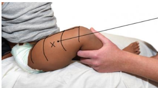
Figure 1 : repérage de la partie antérolatérale de la cuisse (muscle vaste externe)