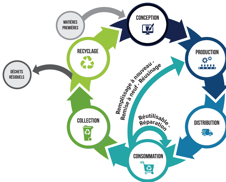
Figure 3 : L'économie circulaire pour les matières plastiques