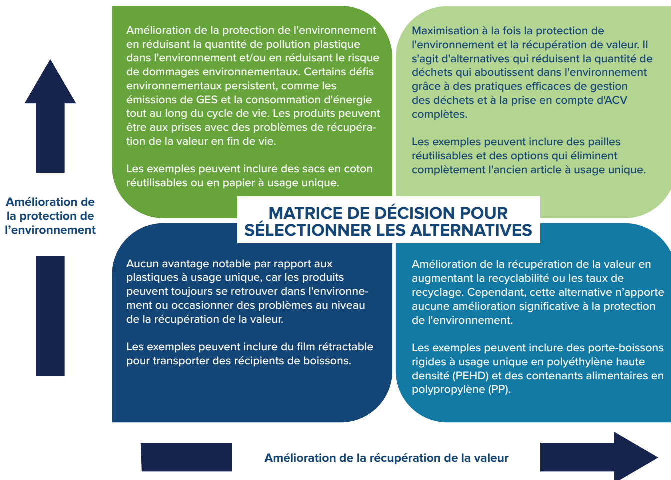
Figure 1 : Matrice de décision pour guider la sélection d'alternatives

La deuxième étape du cadre de gestion consiste à établir des objectifs de gestion. Les objectifs environnementaux proposés par le cadre de gestion des plastiques à usage unique sont les suivants :