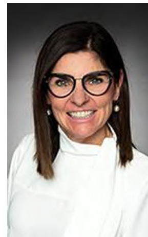
L'honorable Filomena Tassi Ministre responsable de l'Agence fédérale de développement économique pour le Sud de l'Ontario

Je vous invite à lire ce rapport pour en apprendre davantage sur la façon dont FedDev Ontario bâtit une solide culture de l'innovation afin de positionner le Canada comme chef de file dans l'économie mondiale.