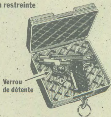
Verrou de détente