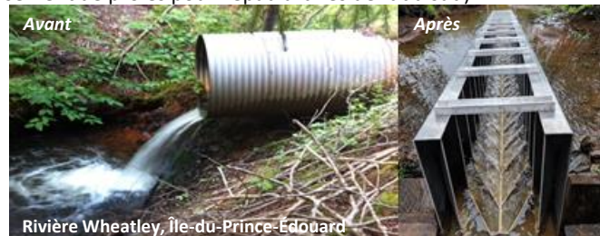
Rivière Wheatley, Île-du-Prince-Édouard

Les projets du FRC doivent aussi avoir un effet positif sur les espèces menacées et en voie de disparition (p. ex. accroissement des populations de poissons qui servent de proies pour l'épaulard résident du sud).