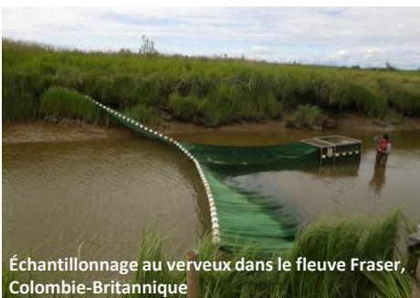
Échantillonnage au verveux dans le fleuve Fraser, Colombie-Britannique

Le FRC permet de répondre à un besoin défini, à savoir contrer les menaces pesant sur les écosystèmes aquatiques ainsi que la perte de biodiversité marine le long des côtes du Canada. Le programme a été conçu en fonction des priorités nationales établies dans le cadre du PPO, et les priorités régionales ont été établies en collaboration avec les intervenants. Les priorités établies ont été prises en compte dans l'évaluation des propositions de projets. Par conséquent, le FRC a versé un financement pour des projets pluriannuels de restauration à grande échelle qui sont conformes aux priorités nationales et régionales, comme l'amélioration du passage du poisson et l'annulation des modifications historiques aux côtes.