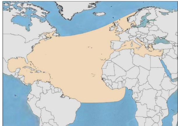
Figure 1. Carte de la sous-population de tortue luth de l'Atlantique Nord-Ouest (référence : Wallace et al. 2010).