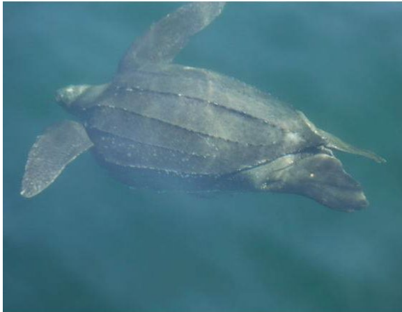
Tortue luth ( Dermochelys coriacea ). Photo du Canadian Sea Turtle Network. Reproduction interdite.