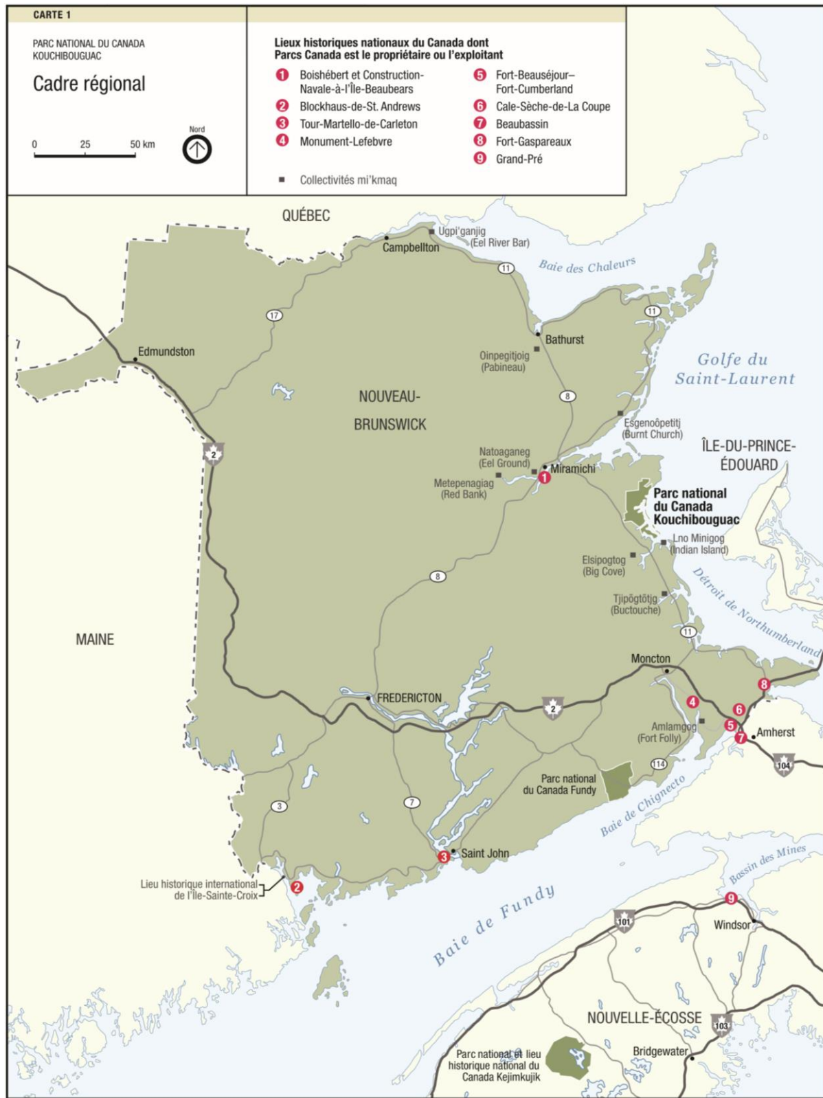
Carte 1 : Cadre régional