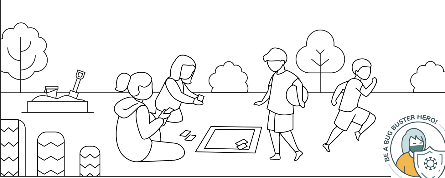
ጠቅላይ ልዩ ልዩ ጥረት ለማሻሻል ለሚደረግበት ስራ ላይ ለሚሳተፉት ሰው ልዩ ልዩ ጥረት ይደረጋል።