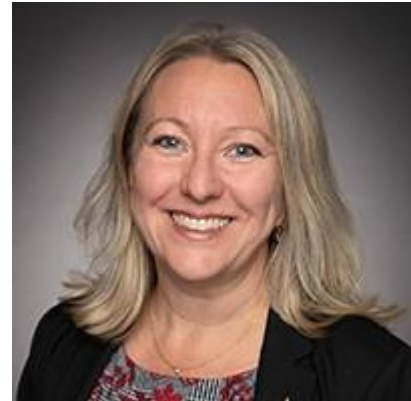
L'honorable Mona Fortier Présidente du Conseil du Trésor

L'honorable Mona Fortier, C.P., députée Présidente du Conseil du Trésor