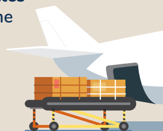
RECETTES DE MARCHANDISES PAR RAPPORT AUX RECETTES D'EXPLOITATION TOTALES, SERVICES RÉGULIERS ET D'AFFRÈTEMENT (%)

Les recettes de marchandises ont représenté 44,0 % du total des recettes d'exploitation au deuxième trimestre de 2020 alors qu'auparavant, elles en représentaient systématiquement moins de 10 % .