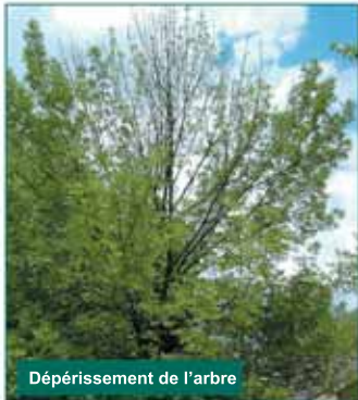
Dépérissement de l'arbre