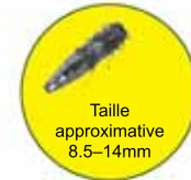
Taille approximative 8.5-14mm