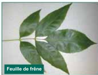
Feuille de frêne