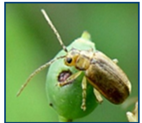
Chrysomèle de la vioerne