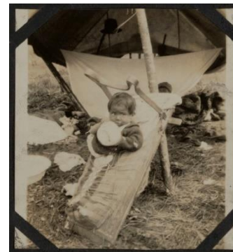
[Un bébé anishinaabe dans un tikinagan, Obishikokaang (Première Nation du Lac Seul), Ontario 1929]. Titre original : Lac Seul, mignon petit enfant, e011504802_s1

Grâce à l'initiative Nous sommes là : Voici nos histoires lxiii , qui vise à numériser et à décrire des centaines de milliers de documents liés aux Autochtones qui figurent dans les collections de BAC, 284 101 documents ont été numérisés en 2022-2023. L'initiative est donc en bonne voie d'atteindre son objectif de