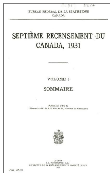
Page couverture de la publication officielle du septième Recensement du Canada, 1931 (OCLC 796971519)

Reconnaissant l'importance de cet outil, BAC a mis en œuvre un plan en plusieurs étapes xxxvii et a conclu des protocoles d'ententes avec FamilySearch et Ancestry® pour assurer la réussite de cette tâche colossale que représentait la numérisation, la transcription, l'indexation et la mise en ligne de 234 678 images (c'est-à-dire le contenu de 187 bobines de microfilm).