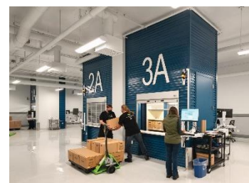
Des employés de BAC déménagent des boîtes

En parallèle, après des mois de préparation, BAC a commencé à déplacer les 590 000 contenants que le nouvel édifice doit abriter. Depuis janvier 2022, c'est plus de 391 536 contenants qui y ont dorénavant trouvé domicile, soit plus de 247 999 boîtes de documents textuels et 143 537 bobines de film.