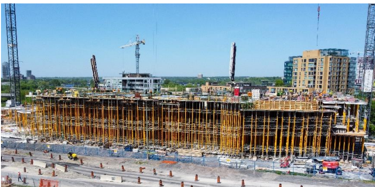
Le chantier de construction d’Ādisōke

La construction de la future installation publique que BAC partagera avec la BPO avance rondement, et selon l’échéancier prévu. Après un an de travaux souterrains, le premier étage d’ Ādisōke liv commence à émerger dans le paysage du centre-ville de la capitale nationale du Canada.