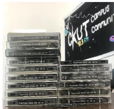
Projet de numérisation de la station de radio CKUT, financé par le PCPD en 2022-2023

En 2022-2023, 39 projets lxvi , dont 33 nouveaux, ont reçu du financement au moyen du Programme pour les collectivités du patrimoine documentaire lxvii de BAC. Parmi les bénéficiaires de cette année se trouve le projet sur l'accès aux archives du Conseil des Premières Nations du Yukon et le projet de traitement des archives de l'organisme The ArQuives – les archives LGBTQ2+ du Canada, qui ont pu évaluer, traiter, organiser et décrire des parties de leurs collections, facilitant ainsi leur préservation et leur accès. Depuis la création du PCPD en 2015, BAC a versé plus de 12 millions de dollars pour appuyer 310 projets des collectivités de partout au pays.