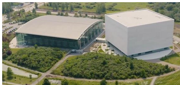
Vue aérienne du complexe de préservation de BAC

BAC a profité de l'occasion pour installer des panneaux d'interprétation le long du sentier de verdure qui ceint le nouvel édifice et son voisin, le Centre de préservation. Les visiteurs et promeneurs peuvent ainsi en apprendre davantage sur l'architecture, la raison d'être et l'environnement de ces deux magnifiques installations qui composent ce qu'on appelle maintenant le complexe de préservation de BAC à Gatineau (Québec).