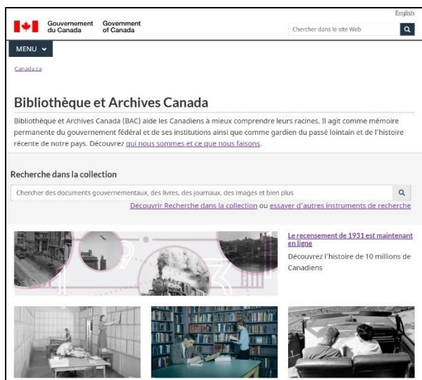
Site Web de BAC

Avec le but avoué de joindre et d'attirer davantage d'usagers de partout au pays, BAC a apporté plusieurs améliorations à l'accès virtuel à ses collections. Le design du site se veut visuellement attrayant et dynamique pour y attirer des publics de tout horizon, alors que la structure du site Web a été repensée afin d'être plus facile à suivre et mieux orienter les usagers.