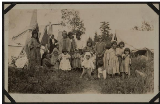
[Photo d'un groupe de femmes anishinaabes et de leurs enfants à l'époque des traités, Obishikokaang (Première Nation du Lac Seul), Ontario, 1929]. Titre original : Époque de la signature du traité, lac Seul, 1928, e011504804_s2

Grâce à l'initiative Nous sommes là : Voici nos histoires lxiii , qui vise à numériser et à décrire des centaines de milliers de documents liés aux Autochtones qui figurent dans les collections de BAC, 284 101 documents ont été numérisés en 2022-2023. L'initiative est donc en bonne voie d'atteindre son objectif de