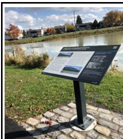
Un panneau d'interprétation

BAC a profité de l'occasion pour installer des panneaux d'interprétation le long du sentier de verdure qui ceint le nouvel édifice et son voisin, le Centre de préservation. Les visiteurs et promeneurs peuvent ainsi en apprendre davantage sur l'architecture, la raison d'être et l'environnement de ces deux magnifiques installations qui composent ce qu'on appelle maintenant le complexe de préservation de BAC à Gatineau (Québec).