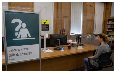
Un archiviste et une usagère dans la salle de généalogie du 395, rue Wellington, à Ottawa

Lorsque les mesures sanitaires liées à la COVID-19 ont été levées, BAC a repris toutes ses activités et rouvert les salles publiques de consultation et de recherche de tous ses points de service nationaux en juillet 2022. Cette année, BAC a effectué plus de 63 012 interactions en personne et à distance, soit autant de réponses et de conseils donnés aux personnes intéressées par ses collections, depuis ses points de service d'Ottawa, d'Halifax, de Winnipeg et de Vancouver.