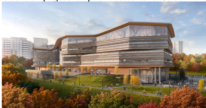
Rendu architectural d'Ādisōke

La collaboration avec la nation hôte algonquine Anishinabeg s'est également poursuivie en 2022-2023, alors que plusieurs rencontres avec des membres et des aînés des communautés de Pikwakanagan et de Kitigan Zibi ont eu lieu pour discuter des futurs services et de la programmation de l'installation partagée. Enfin, au centre des inestimables contributions des communautés autochtones à Ādisōke, se trouve un projet d'art public autochtone. Ce dernier a franchi une nouvelle étape puisque, en février 2023, les artistes qui ont été sélectionnés pour y prendre part ont participé à deux journées d'information, de formation et d'échanges. Les œuvres qu'ils créeront seront présentées à l'intérieur et à l'extérieur de l'édifice.