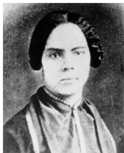
Portrait de Mary Ann Shadd Cary, vers 1855-1860, c02977