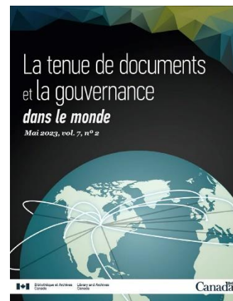
Page couverture d'une édition de La tenue de documents et la gouvernance dans le monde

BAC a également poursuivi son rôle de chef de file en matière de préservation numérique autant auprès du gouvernement fédéral et des universités canadiennes en participant au Groupe de travail sur la préservation numérique xxiv , qu'à l'international, en partageant ses pratiques en matière de préservation au sein du Consortium international pour la préservation de l'Internet xxv (en anglais seulement) et de la Coalition de préservation numérique xxvi (en anglais seulement).