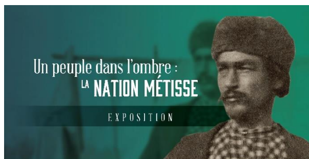
Image promotionnelle de l'exposition Un peuple dans l'ombre : La Nation métisse

Battleford (Saskatchewan), permettant ainsi à près de 9 000 visiteurs d'en apprendre plus sur les ressources de BAC en ce qui concerne la Nation Métisse. Depuis sa création en 2017, cette importante exposition a été présentée dans 14 emplacements différents, et a été vue par plus de 120 000 visiteurs.