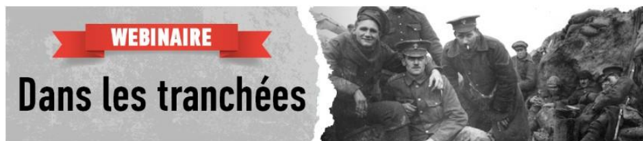
Image promotionnelle du webinaire Dans les tranchées

Près d'une quarantaine d'ateliers, de séances d'information et de visites ont été offerts au courant de l'année