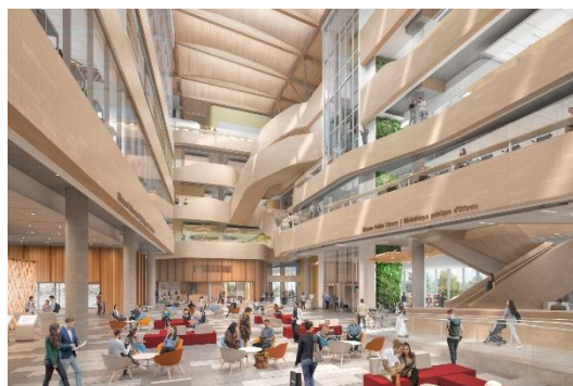
Image du futur espace de rassemblement central d'Ādisōke

Les partenaires du projet ont placé un objet symbolique à l'intérieur d'une dalle de béton de la fondation d'Ādisōke. BAC y a mis une reproduction de L'Abeille, qui fut la première acquisition faite par le premier archiviste fédéral nommé le 20 juin 1872, ainsi qu'une photo montrant l'ouverture officielle du 395, rue Wellington, qui a eu lieu le 20 juin 1967.