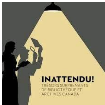
Image promotionnelle de l'exposition Inattendu! Trésors surprenants de BAC

Cette année, BAC a conclu dix ententes de prêts, ce qui a permis l'exposition de 75 pièces de ses collections un peu partout au pays. Parmi celles-ci, l'exposition Inattendu! Trésors surprenants de Bibliothèque et Archives Canada xxxviii , présentée en partenariat avec le Musée canadien de l'histoire, a attiré plus de 15 000 visiteurs depuis son ouverture en décembre 2022.