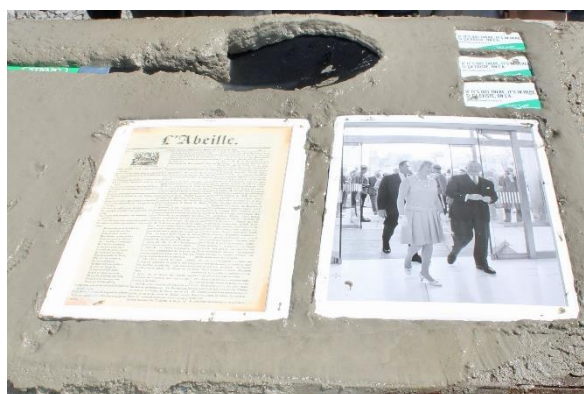
Objets placés dans une des dalles de béton, de l'édifice Ādisōke