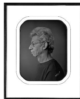
Daguerréotype portrait de Gabor Szilasi / R9382-4

Enfin, Parcs Canada a transféré à BAC en 2022-2023 d' importants documents xviii qui témoignent de la construction, de l'entretien et de l'exploitation des canaux de Beauharnois, de Chambly, de Carillon, de Grenville, de Soulanges, de St-Ours, de Lachine et de Culbute. Ces canaux constituaient un élément fondamental des réseaux de transport et de communication du Canada et ont joué un rôle important dans la défense et le développement commercial du Canada au XIX e siècle et au début du XX e siècle.