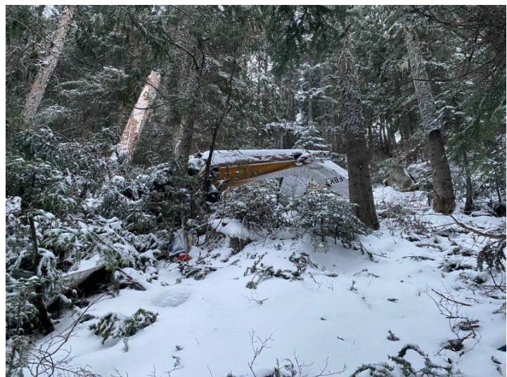
Figure 2. Lieu de l'accident

L'enquête a permis de déterminer qu'il n'y avait aucun signe de défaillance mécanique ni de mauvais fonctionnement des systèmes avant