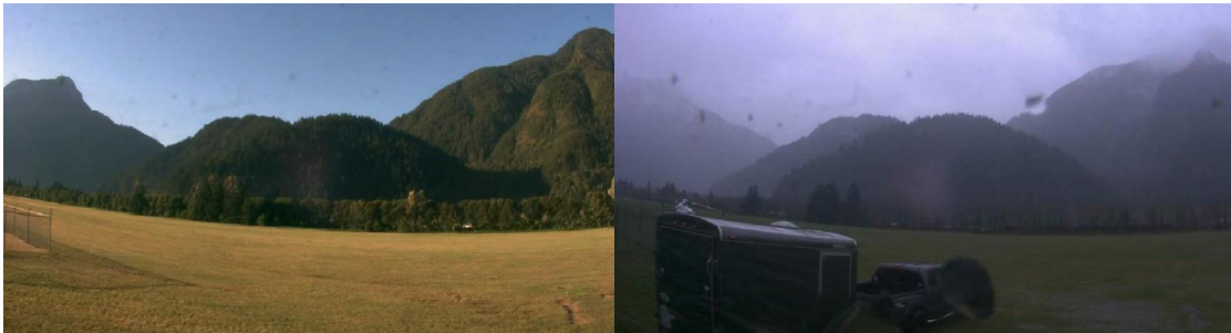
Figure 3. Vue sud-est captée à l'aérodrome de Hope par temps clair (à gauche) et vers 15 h le jour de l'événement (à droite)

L'aérodrome de Princeton (CYDC) (Colombie-Britannique) se trouve à 25 NM à l'est du lieu de l'événement. Les conditions météorologiques enregistrées à 16 h à l'aérodrome étaient les suivantes :