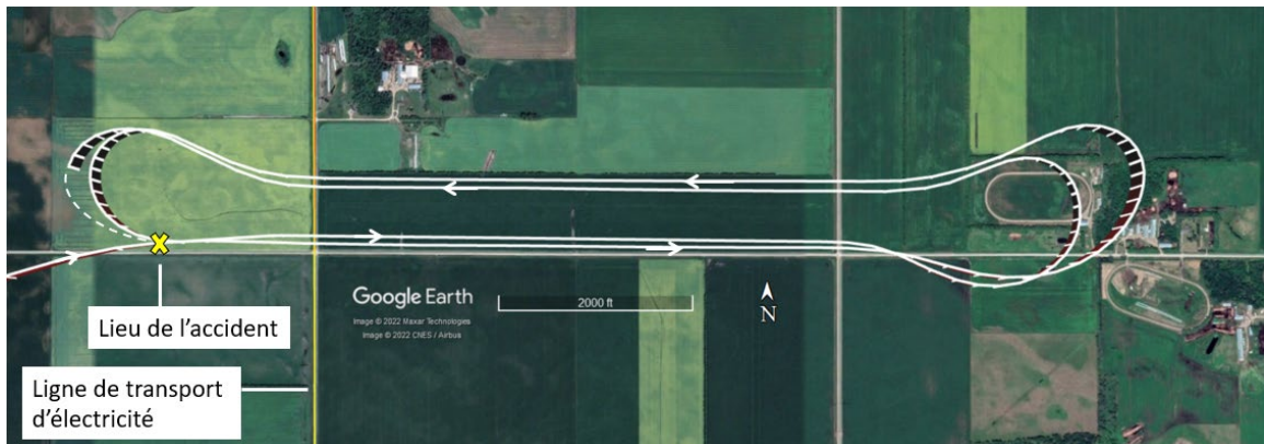
Figure 1. Trajectoire réelle (ligne continue) et trajectoire estimée (ligne pointillée) du vol à l'étude d'après les données du GPS (système de positionnement mondial)

La radiobalise de repérage d'urgence s'est déclenchée à la suite de l'impact et le Centre conjoint de coordination de sauvetage à Trenton (Ontario) a reçu le signal à 20 h 05. La GRC (Gendarmerie royale du Canada), le service d'incendie de la municipalité rurale de Grey et les services médicaux d'urgence de la province sont intervenus sur les lieux. Le pilote a été mortellement blessé. L'aéronef a été détruit.