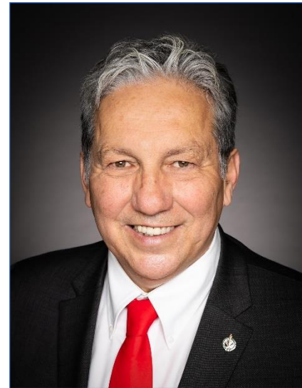
L'honorable Dan Vandal, Ministre des Affaires du Nord, ministre responsable de Développement économique Canada pour les Prairies et ministre responsable de l'Agence canadienne de développement économique du Nord

Nous vous invitons à lire ce rapport pour découvrir comment CanNor façonne la durabilité économique et la prospérité à long terme dans les territoires.