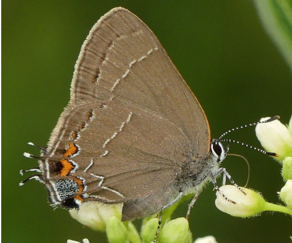
Figure 2. Thècle méridionale d'Ontario ( Satyrium favonius ontario ) au stade adulte, photographiée dans la zone de protection de la nature Reid (4a), à Wallaceburg, en Ontario. 26 juin 2016. Spécimen non capturé.