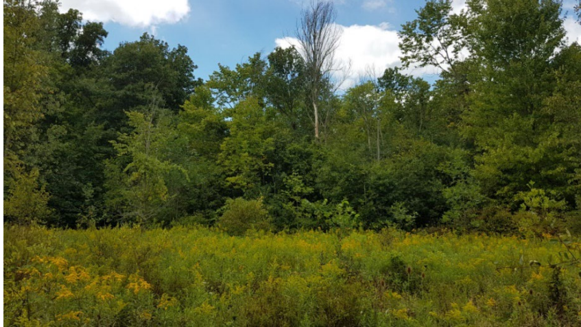
Figure 5. Habitat de la thècle méridionale d'Ontario ( Satyrium favonius ontario ) dans la zone de protection de la nature Reid (4a), vu d'un pré situé à proximité d'un boisé à chênes et caryers où des thècles méridionales d'Ontario se nourrissant de nectar ont été observées. Photo : Jessica Linton (septembre 2020).