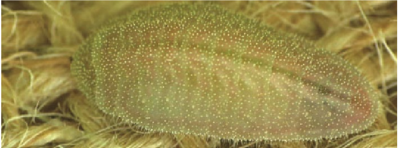
Figure 1. Chenille de thècle méridionale d'Ontario ( Satyrium favonius ontario ) provenant de Great Blue Hill, à Canton, dans le comté de Norfolk, au Massachusetts. Chenille prélevée pour élevage en captivité à l'Université du Connecticut.

Les chenilles sont jaunâtres et ressemblent à des limaces. Leur corps présente des rayures dorsales vertes et une rayure latérale jaune (Gagliardi et Wagner, 2016) (figure 1). La couleur de fond est habituellement vert pâle à vert glauque, et une bande médiodorsale est visible le long de l'abdomen. On compte cinq stades larvaires. Le corps des chenilles devient rose dans la deuxième moitié du dernier stade larvaire (Gagliardi et Wagner, 2016).