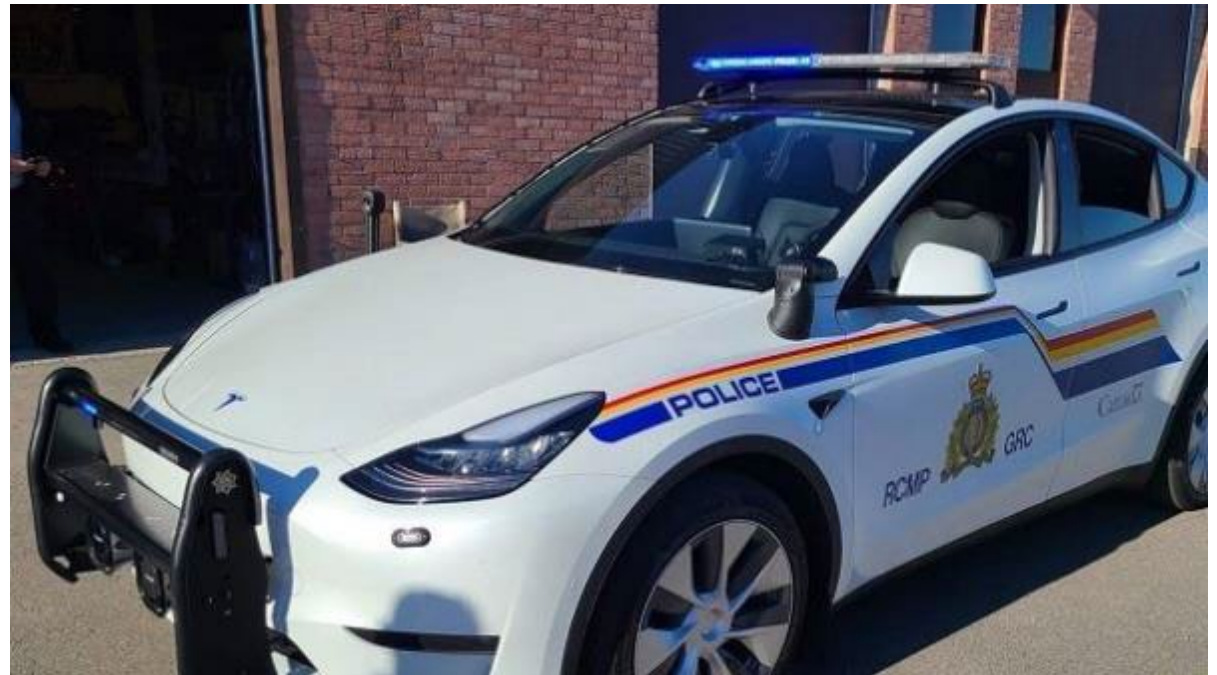
En 2023, le Détachement de West Shore a dévoilé le premier véhicule entièrement électrique de la GRC, un Tesla Model Y, entièrement équipé pour répondre aux normes policières.

La GRC dispose d'un parc de véhicules terrestres, aériens et maritimes pour répondre à ses besoins opérationnels. Le parc de véhicules de sûreté et de sécurité nationales (SSN) de la GRC comprend 14 000 véhicules terrestres qui permettent aux membres de fournir des services de police partout au Canada. Il s'agit de véhicules légers (berlines, véhicules utilitaires sport, camionnettes et fourgonnettes), de véhicules moyens et lourds, de motos et de nombreux véhicules hors route (motoneiges, véhicules tout-terrain, véhicules utilitaires tout-terrain) qui répondent à un large éventail de besoins opérationnels (camions à bombes, camions à chiens, postes de commandement mobiles, chargeurs frontaux, plates-formes de véhicules blindés, etc.).