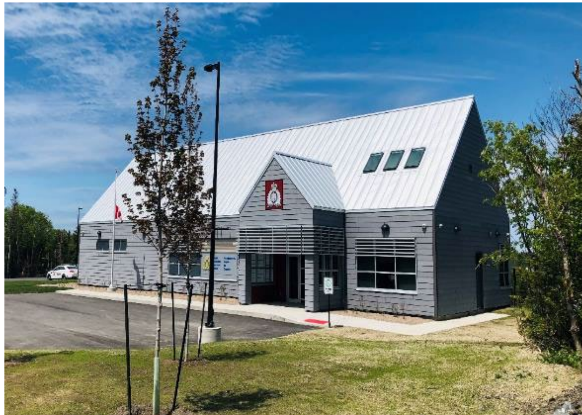
Inauguré en 2021, le Détachement de la GRC de Rocky Harbour (T.-N.-L.) est un bâtiment carboneutre qui comprend une conception thermique de pointe, ainsi qu'un éclairage et des installations sanitaires automatisés.

La GRC s'efforce également de remplacer ou de convertir, d'ici 2030, les systèmes de chauffage, de ventilation, de climatisation et de réfrigération (CVCR) existants qui utilisent des réfrigérants à fort potentiel de réchauffement