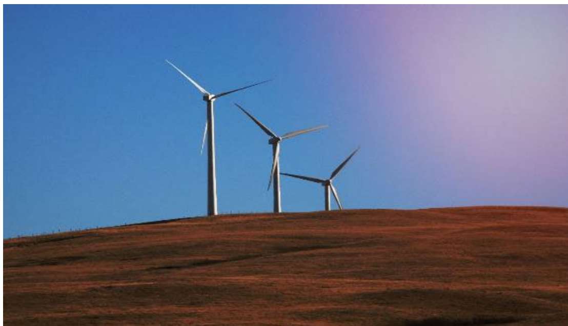
SaskPower et le Canada travaillent de concert au développement d'une nouvelle infrastructure d'électricité renouvelable qui produira et fournira au réseau électrique local une puissance équivalente à la consommation des bâtiments et installations de la GRC en Saskatchewan.

La GRC effectue régulièrement des examens de contrôle de la qualité préalables aux appels d'offres 5 . Dans le cadre de ce processus, elle intègre des critères environnementaux aux documents contractuels. Afin de progresser vers l'atteinte des objectifs de la Politique d'achats écologiques, la GRC examinera et mettra à jour les outils et les conseils fournis aux responsables des achats, en se concentrant sur le renforcement des critères environnementaux appropriés pour les catégories de biens et de services qui ont un impact élevé.