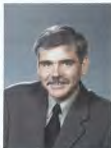
Le secrétaire d'État (Développement rural) (FedNor),

Tandis que nous misons sur nos réussites antérieures pour nous attaquer aux défis de demain, FedNor continuera d'investir dans la ressource la plus précieuse du Nord : les gens!