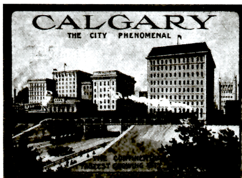
CALGARY, LA VILLE PHÉNOMÉNALE

Les publications suscitent un vif intérêt chez les historiens de l'art, de l'architecture, du développement urbain et de la photographie au Canada. Elles possèdent un immense attrait en tant que témoins d'une période dans l'histoire d'un jeune pays, qui a été caractérisée par une croissance rapide et une ambition grandiose.