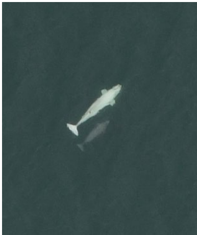
Photographie aérienne de bélugas de la population de l'est de la mer de Beaufort prise au cours du relevé de 2019.