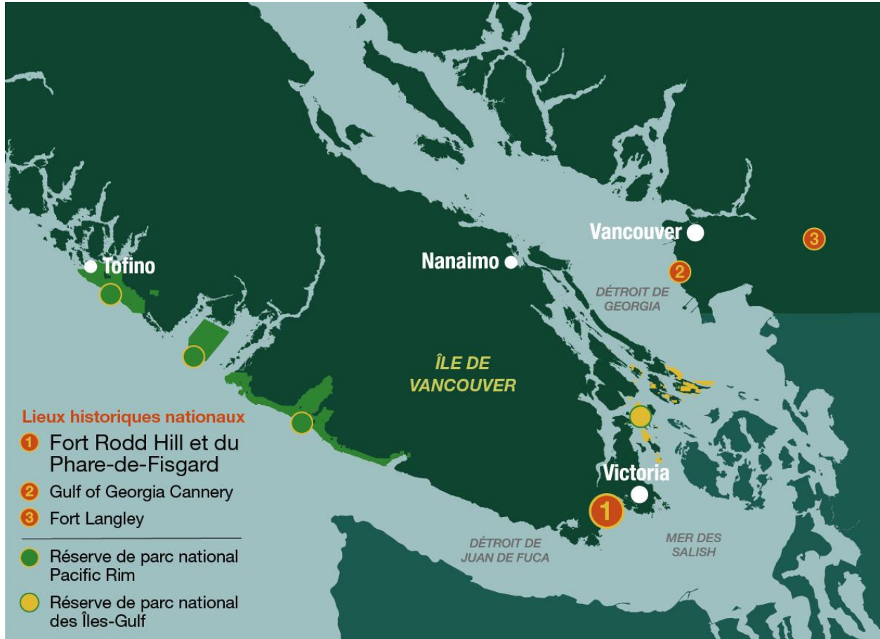
Carte 1 : Cadre régional

terres avoisinantes contribuent aux efforts du Canada en matière de conservation de la biodiversité. À titre de lieux historiques nationaux et de précieux espaces verts, les lieux historiques nationaux Fort Rodd Hill et du Phare-de-Fisgard proposent des expériences exceptionnelles dont tout le monde peut profiter.