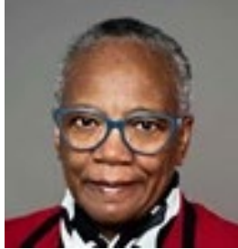
L'honorable Wanda Thomas Bernard Vice-présidente