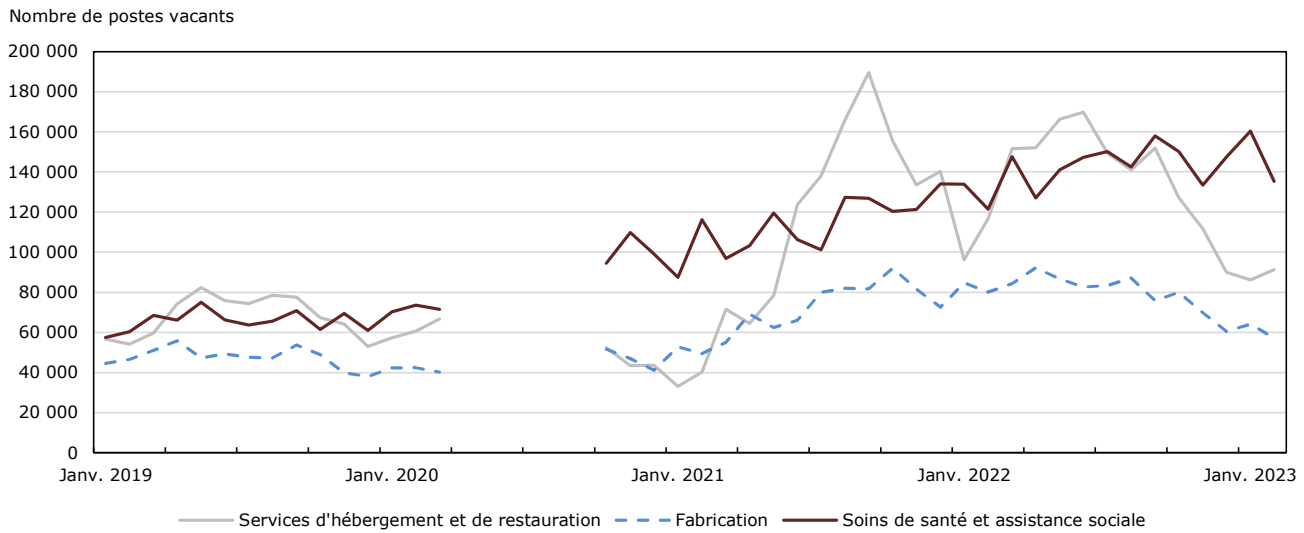
Graphique 1 Postes vacants, certaines industries

Notes : Il n'y a pas de données sur les postes vacants pour la période d'avril 2020 à septembre 2020. Les données ne sont pas désaisonnalisées.