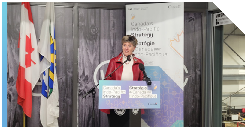
La ministre Bibeau annonçant l'emplacement du Bureau d'Agriculture et Agroalimentaire dans l'Indo-Pacifique, en décembre 2022