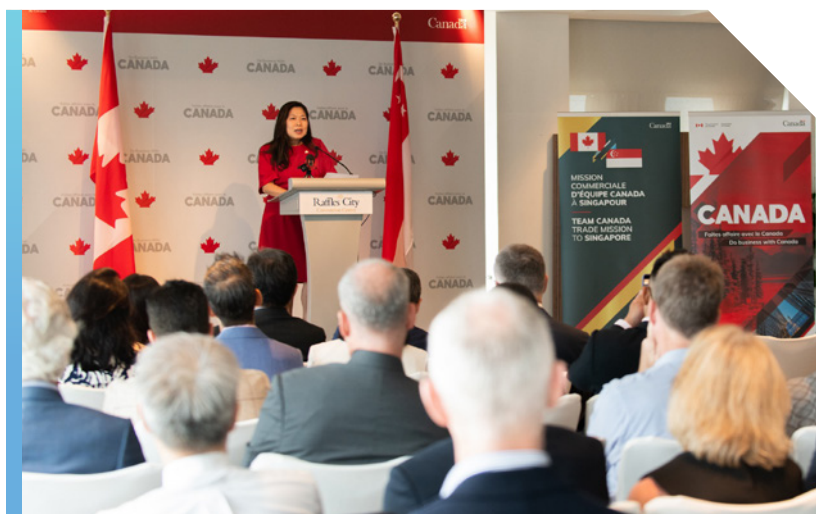
La ministre Ng lance les missions commerciales d'Équipe Canada à Singapour, en février 2023