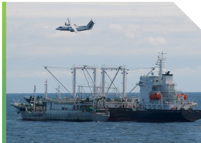
Première mission de patrouille contre la pêche INN dans l'Indo-Pacifique

Un protocole d'entente a été signé avec les Philippines pour déployer la plateforme de détection des navires sombres auprès des autorités locales (octobre 2023).