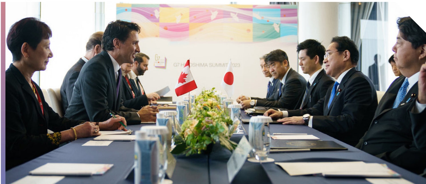
Le premier ministre Trudeau au Sommet du G7 en 2023 à Hiroshima, au Japon

— Le Canada a nommé son premier envoyé spécial pour l'Indo-Pacifique (avril 2023), ainsi que le premier représentant commercial du Canada pour l'Indo-Pacifique (septembre 2023), afin de soutenir la coordination et la cohérence des politiques au sein du gouvernement et des activités du Canada dans la région.