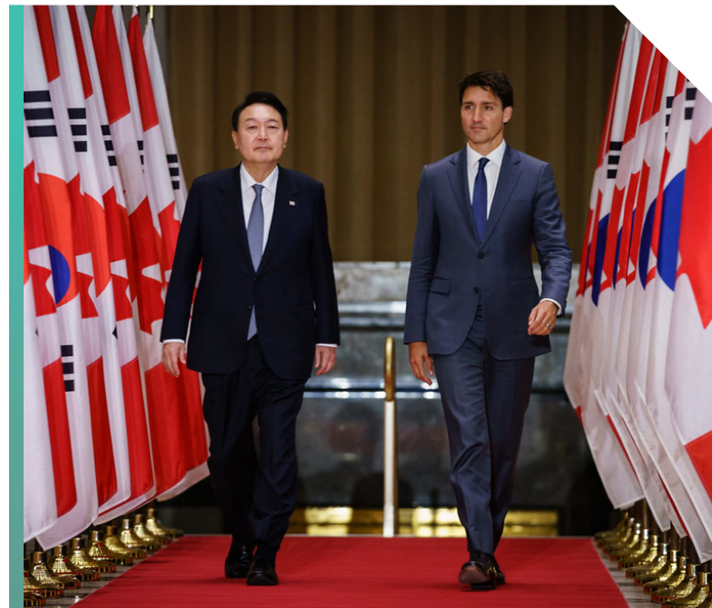
Le premier ministre Justin Trudeau rencontrant le Président de la République de Corée, Yoon Suk Yeol, en septembre 2022