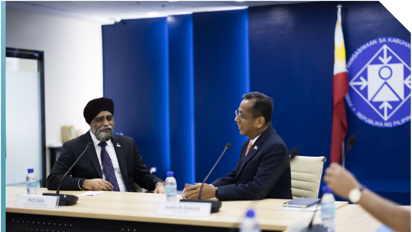
Visite du ministre Sajjan aux Philippines, en mars 2023