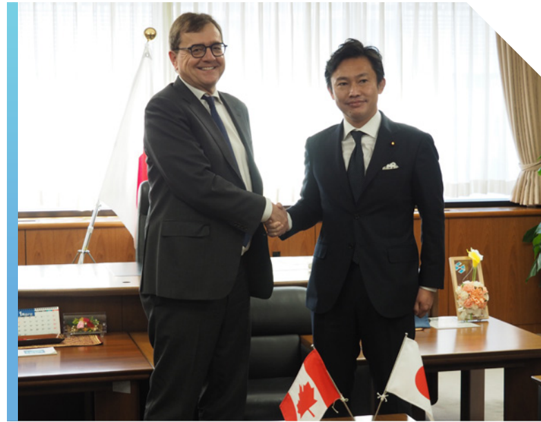
Le ministre de l'Énergie et des Ressources naturelles, Jonathan Wilkinson, rencontre son homologue japonais, en janvier 2023