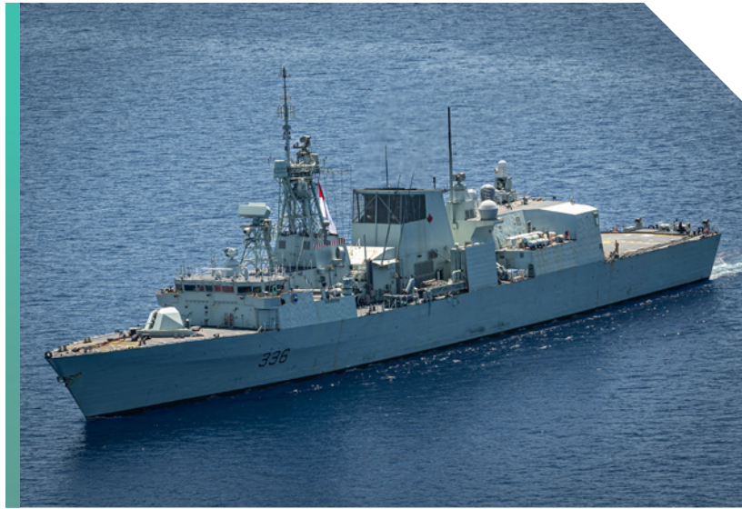
Le NCSM Montréal de la MRC a été déployé dans l'Indo-Pacifique en 2023

d'un navire de soutien, le NM Astérix (de mars à décembre 2023) pour soutenir l'opération NEON et l'opération HORIZON (anciennement PROJECTION).