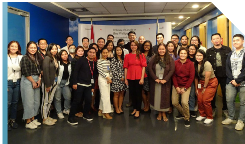
Ouverture du Centre d'opérations mondial d'IRCC aux Philippines