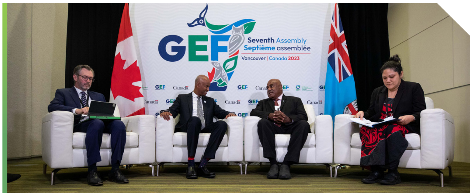
Le ministre actuel du Développement international, Ahmed Hussen, participe à l'assemblée du Fonds pour l'environnement mondial à Vancouver, en 2023.