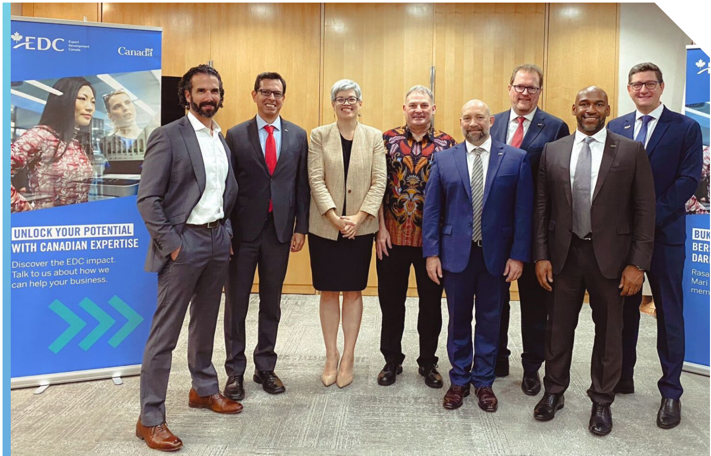
Ouverture du bureau d'EDC en Indonésie, en septembre 2023