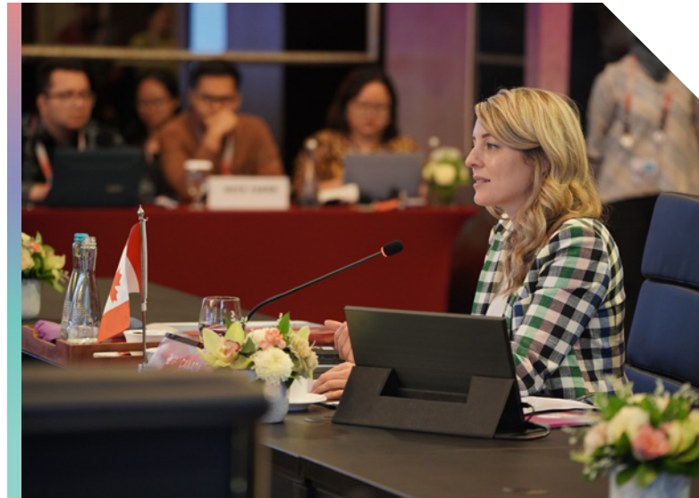
La ministre Joly à la conférence post-ministérielle de l'ANASE de 2023 à Jakarta.