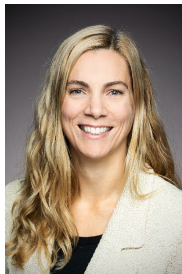
L'honorable Pascale St-Onge, C.P., députée Ministre du Patrimoine canadien

À titre de ministre du Patrimoine canadien, je suis ravie de présenter le Rapport sur les résultats ministériels de 2023-2024 préparé par la CCBN. Je tiens à souligner tout le travail accompli pour servir la population et participer à l'atteinte des objectifs du gouvernement au cours de la dernière année.