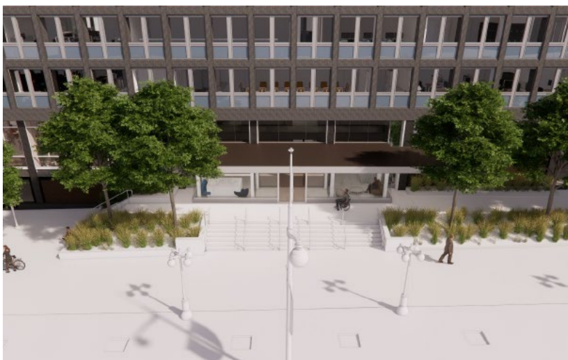
Entrée principale du 80, rue Elgin.