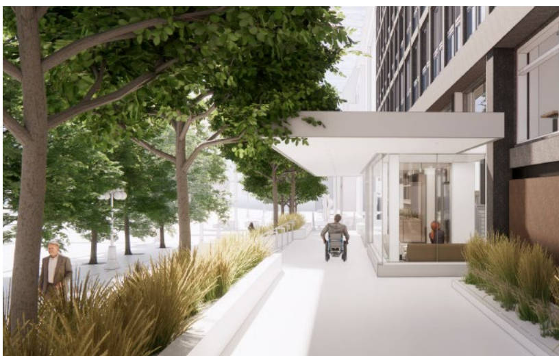
Vue latérale de l'entrée du 80, rue Elgin, illustrant l'utilisation de la rampe d'accès pour fauteuils roulants.