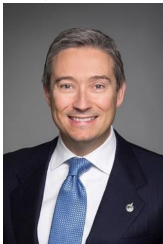
L'honorable François-Philippe Champagne Ministre de l'Innovation, des Sciences et de l'Industrie

Nous sommes heureux de vous présenter le Plan ministériel 2024-2025 du Conseil national de recherches du Canada (CNRC), qui expose les principales priorités que le CNRC s'efforcera de faire progresser pour le bien de la population canadienne.