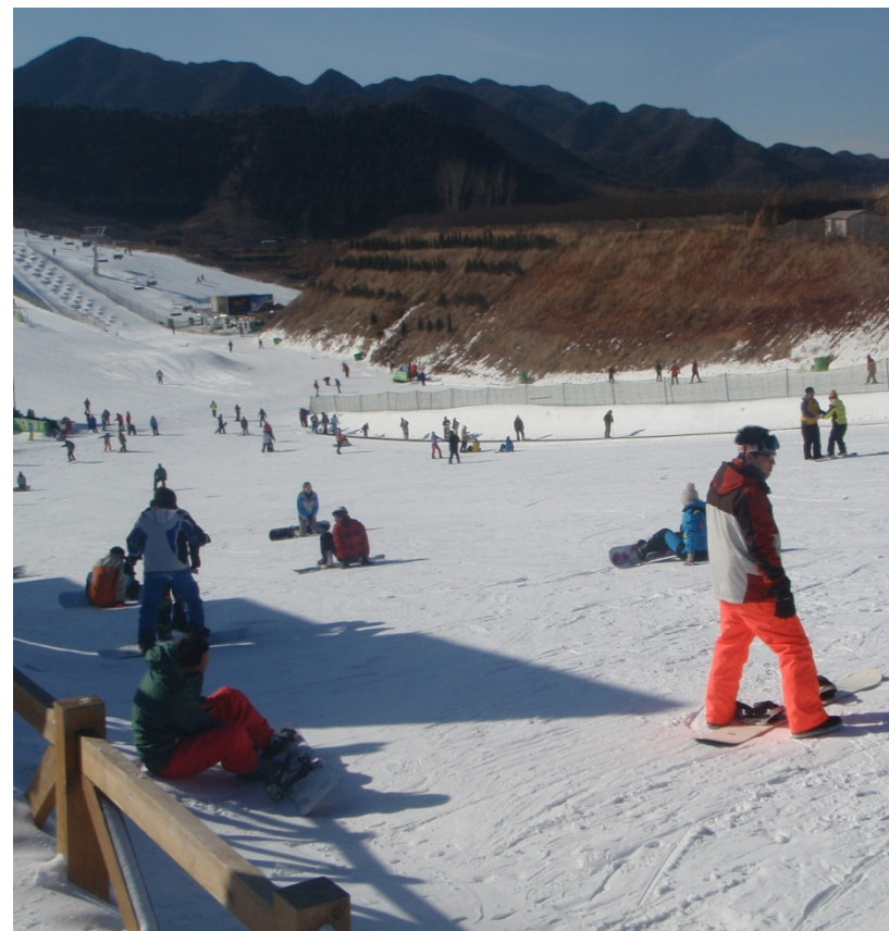
Skieurs à la station de Beijing Nanshan.