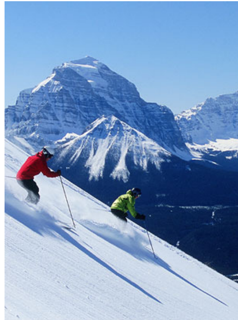
Skieurs près de Lake Louise