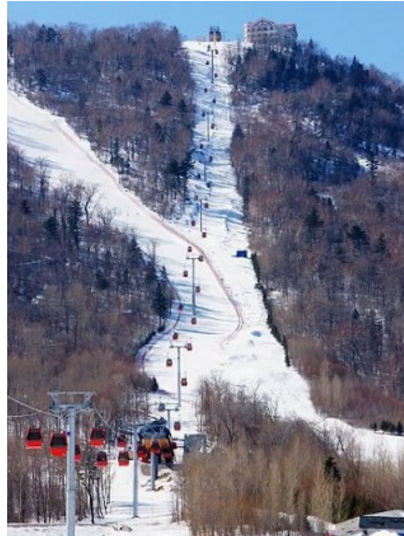
Télécabine à Yabuli Sun Mountain, une station récemment rénovée.