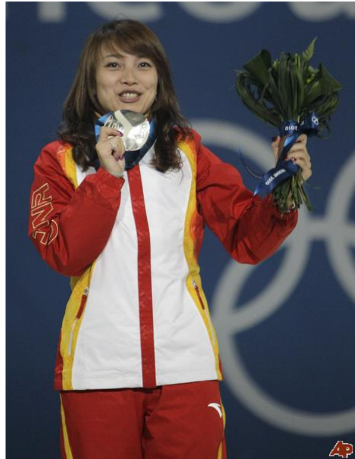
La Chinoise Nina Li, gagnante d'une médaille d'argent en saut lors des Jeux olympiques d'hiver de 2010 à Vancouver.