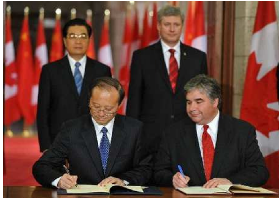
Le Canada a obtenu le statut de destination approuvée en 2010.