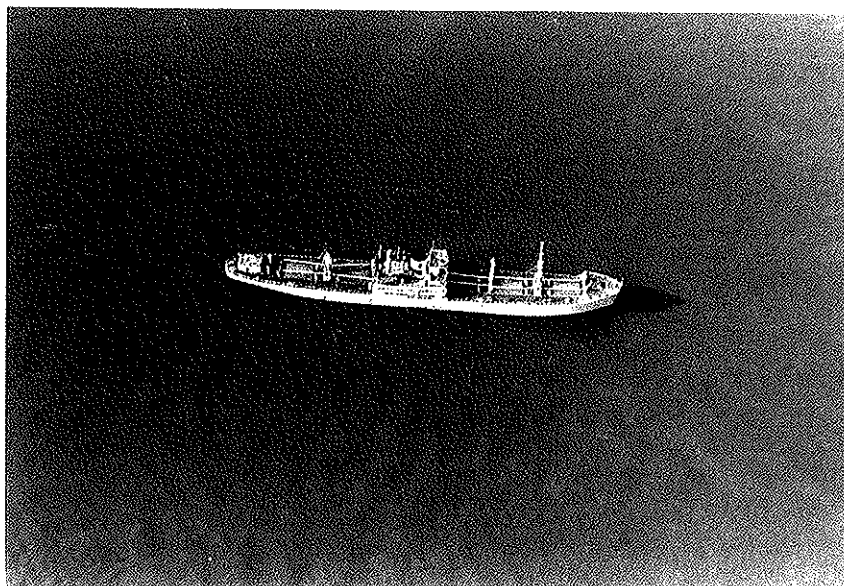
Photo No. 1 Le "Festivity" à l'ancre hors du chenal de navigation - Deschailons, Qué. - Le 11 Oct. 73