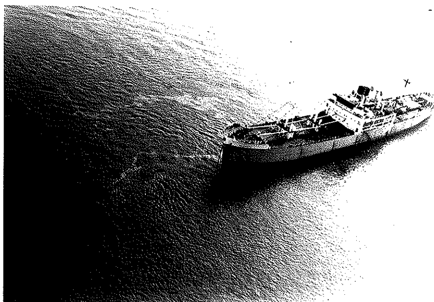
Photo No. 2 Vue de l'échappement de mazout à tribord.