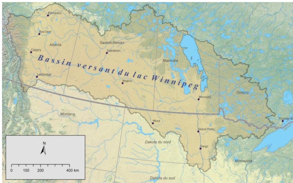
Figure 1. Bassin hydrographique du lac Winnipeg