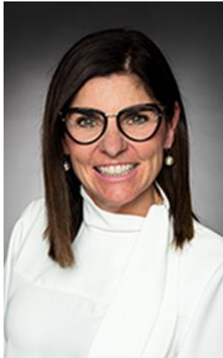
L'honorable Filomena Tassi, C.P., députée

Ministre responsable de l'Agence fédérale de développement économique pour le Sud de l'Ontario