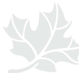
Figure 1 : Les agences de développement régional du Canada

Le programme de Croissance économique régionale par l'innovation (CERI) est exécuté par l'entremise de sept agences de développement régional dans leur région respective (figure 1).