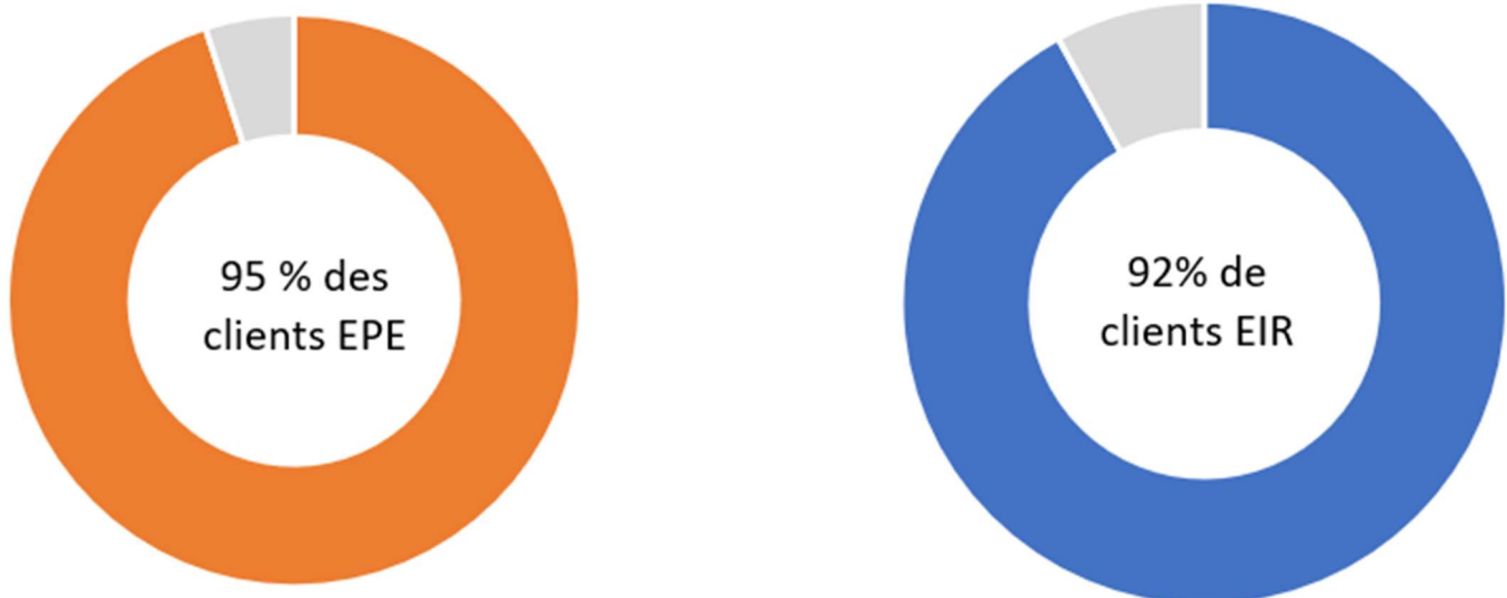
Figure 10 : Pourcentage de clients qui conviennent que le Programme CERI est adapté aux besoins du Nord de l'Ontario ( EPE , n=21; EIR , n=12)

Les résultats du sondage auprès des clients directs des volets EPE et EIR appuient les conclusions des entrevues confirmant que le Programme CERI de FedNor est bien adapté aux besoins du Nord de l'Ontario (figure 10).